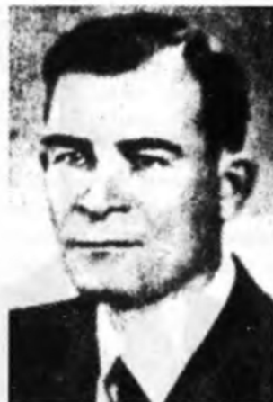
Генерал-хорунжий В. ФИЛОНОВИЧ