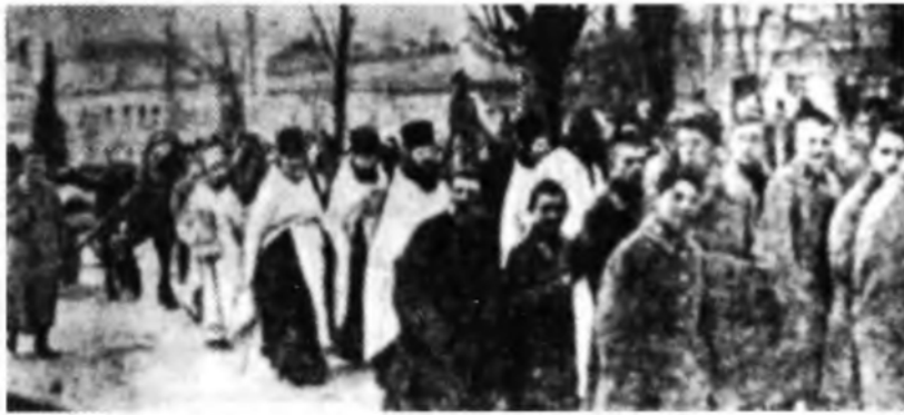
Перевезення тлінних останків Героїв Крут з місця їх тимчасового поховання до Києва. Березень 1918 р.