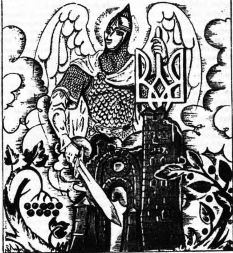
Обкладинка і титульна сторінка книги Є. Маланюка «Крути. Народина нового українця». Прага, 1941 р.

Ці питання можна продовжувати без кінця. Ми твердо знаємо, що князь Олег умер від гадюки, що виповзла з черепа його коня, і що з черепа Святослава Завойовника зробив собі чару печенізький хан, але вже слабше пам'ятаємо про щит Олега на брамі Царгорода і що Святослав справді був забитий, але саме в часі творення ним світової імперії — від Тмутаракані до Болгарії. Ми захоплювалися і захоплюємося «Словом о полку Ігоревім», захоплюємося естетично, особливо «Плачем Ярославни», що ним захоплювався сам Шевченко, але забуваємо при тім, що це є твір, пронизаний трагічною нотою упадку київської великодержави, геніальний твір цей оспівує: остаточно поразку і що є взагалі твором схилку доби, закінчення, а не розквіту, твором, що в нім іскриється лише відблиски минулого, повного боротьби, перемог, героїзму, брязкоту зброї, словом, отого самого «мажору». Може, тому співець «Слова» з таким зітханням згадує про Бояна, що жив у часи, коли не було ще трагічних роздвоєнь почуття, коли вистачило покласти свої «віщі персти» на струни, що вони «самі славу князем рокотаху».