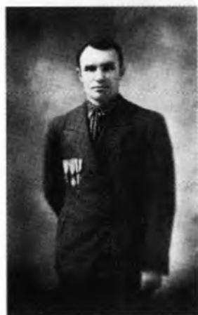
Архімандрит СВЯТОСЛАВ МАГАЛЯС