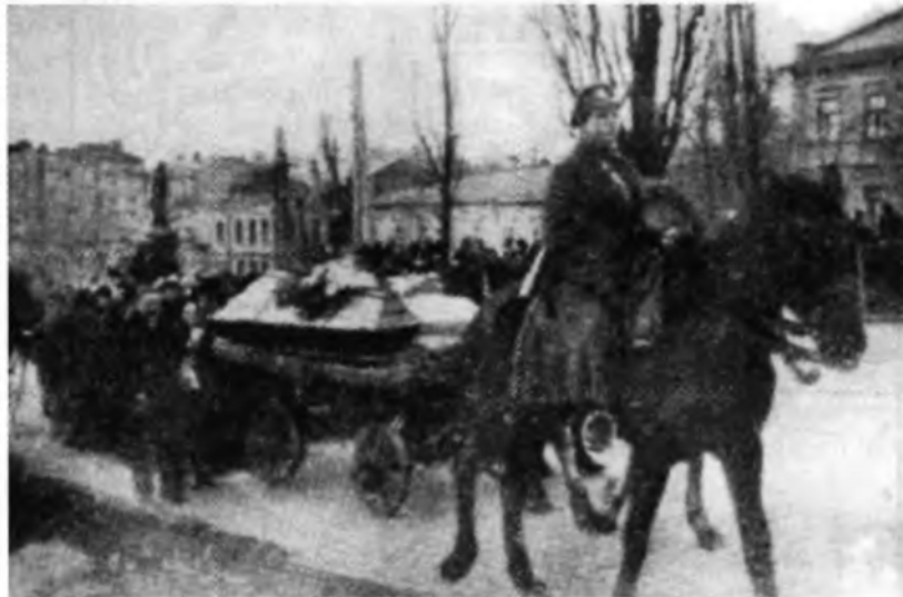
Поховон загиблих при обороні ст. Крути Південно-Західної залізниці в січні 1918 р. в м. Києві.