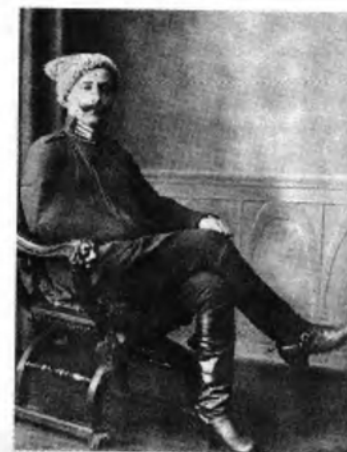
Генерал-поручник О. ВИШНІВСЬКИЙ