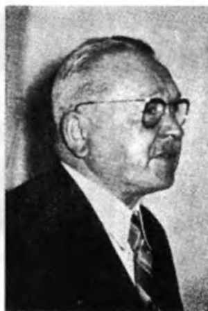
Генштабу генерал-полковник ОЛЕКСАНДЕР УДОВИЧЕНКО