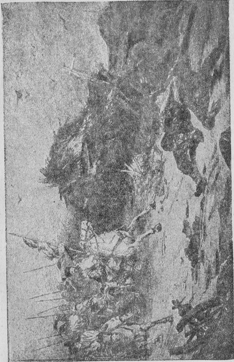
Атака козаської кінноти.