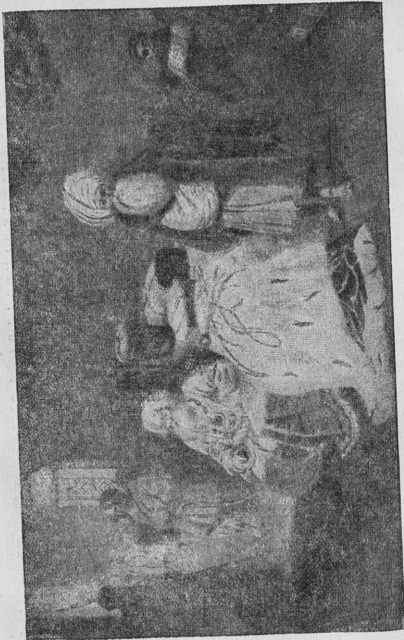
Дари в Чигирині. З малюнка Т. Г. Шевченка.