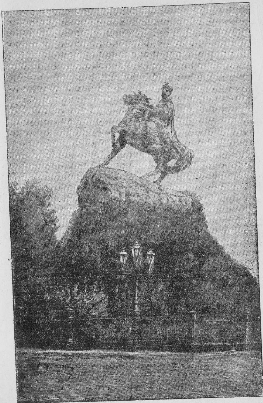
Пам'ятник Богдану Хмельницькому в Києві.