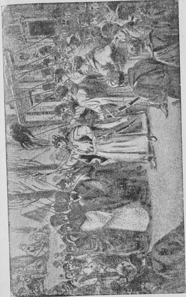
Рада в Переяславі.