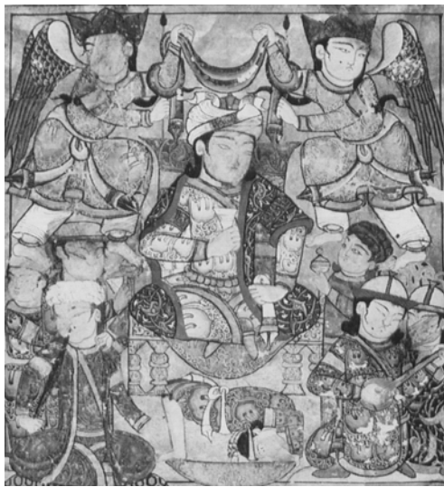
Мініатюра з мусульманським правителем. Єгипет, XIV ст.

Політичний вплив передбачав як мінімум тимчасову присутність степових військових та адміністраторів на підконтрольній території, обмін посольствами та інші персональні контакти між степовиками та осідлим населенням. Це створило передумови для запозичення степових звичаїв на селенням підконтрольних територій.