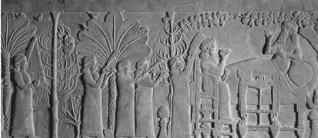
Рельєф із сценою асирійського царя Ашшурбаніпала. VII ст. до н.е.

заповідання їх вічності. Не випадково посланці короля Кастилії до самаркандського завойовника Тимура, добре познайомившись зі степовими ритуалами останнього, уважно занотували: «Те свято, де п'ється вино, вважається важнішим» 21 . Ось звідкіля беруться витoki поширеної в Євразії традиції вживати алкоголь з нагоди релігійних свят та інших важливих подій.