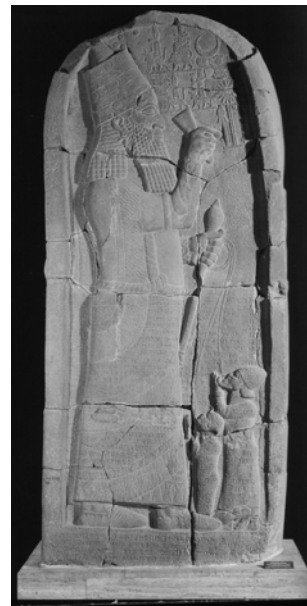
Стела з асирійським царем Асаргаддоном. VII до н.е.

На час організації постачання грецького вина у Північне Причорномор'я скіфи уже повернулися з Передньої Азії, де воювали упродовж двох століть. Там вони були свідками ритуального споживання вина царями. До нашого часу уціліли монументальні зображення союзників скіфів асирійських царів Асаргаддона (680–669 до н.е.) 18 та Ашшурбаніпала (668–627 до н.е.) 19 в моменти їхніх тріумфів – із келихом чи ритонном в руках. Вміст царського келиха не викликає сумніву, оскільки в сцені тріумфу Ашшурбаніпала він з царицею зображений під виноградними лозами. Обидва ж зображення демонструють перемоги царів: Асаргаддон замовив на зображенні постаті сирійського царя та єгипетського фараона, яких він тримав за мотузки, прив'язані за їхні шиї, а Ашшурбаніпал бенкетував у саду, де на одному з дерев була почеплена голова переможеного еламського царя. Отже, вино тут постає як напій безсмертя і гідності.