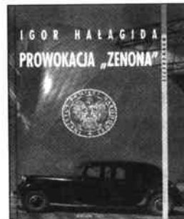
Обкладинка книги про провокацію "Зенона" та деякі її жертви

АВГУСТ 1947 г. Командир УПА БЕЛЕЙОВИЧ и ЧАВЯК при следовании из Украины в Мюнхен задержаны в Чехословакии, границу перешли в В-Березнянском районе, Закарпатской области.