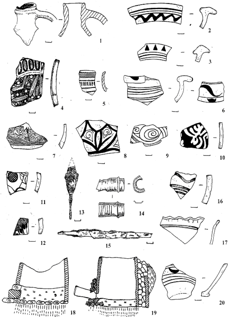
Рис. III. Речові знахідки з розкопів III та IV

1 – червоноглиняна кераміка; 4, 5, 7 – сіроглиняна кераміка; 2, 3, 6, 10, 20 – червоноглиняна кераміка з ангобованою поверхнею; 8, 9, 11, 12, 16, 17 – полив’яна кераміка; 13 – залізний наконечник стріли; 14 – фрагмент глиняної труби; 18, 19 – розрізи тандирів 1, 2, 3.