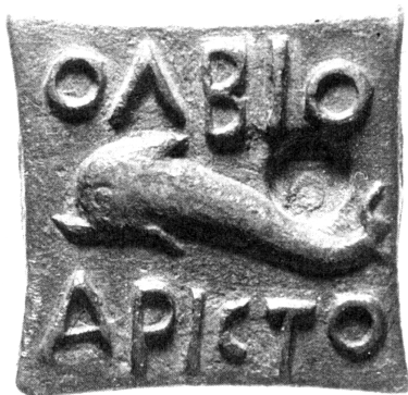
1. Ольвийская эталонная ги́ря с изображением дельфина.