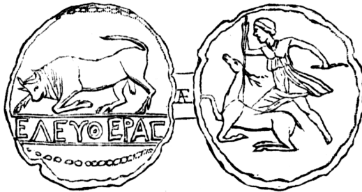
6. Херсонесская монета с изображением Артемиды, закалывающей копьём лань.