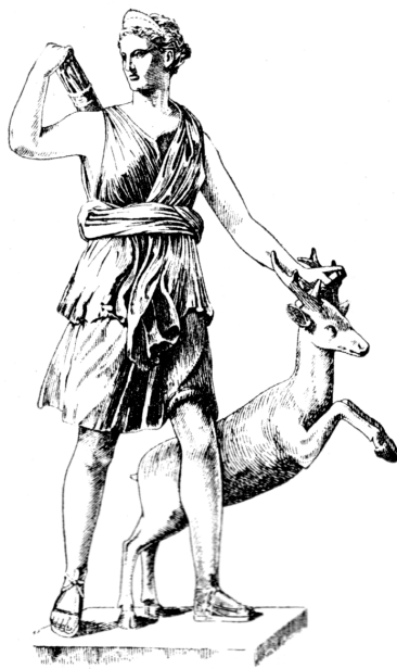
5. Статуя Артемиды с ланью. Римская копия с греческого оригинала.