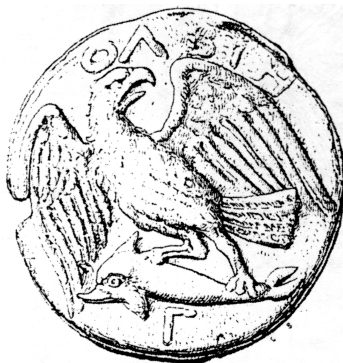
2. Ольвийская монета с изображением орла и дельфина.