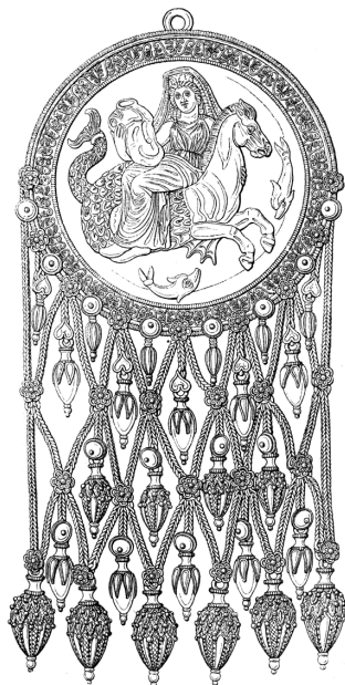
3. Золотые серьги с изображением дельфинов около Фетиды, везущей оружие Ахиллу.