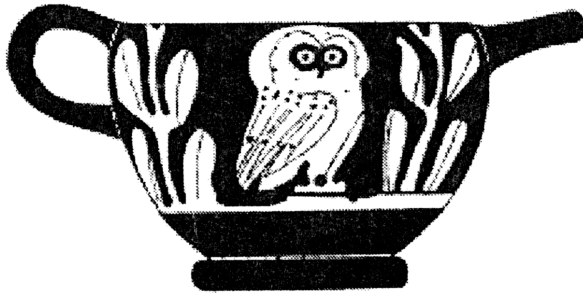
7. Аттический краснофигурный скифос с изображением совы.