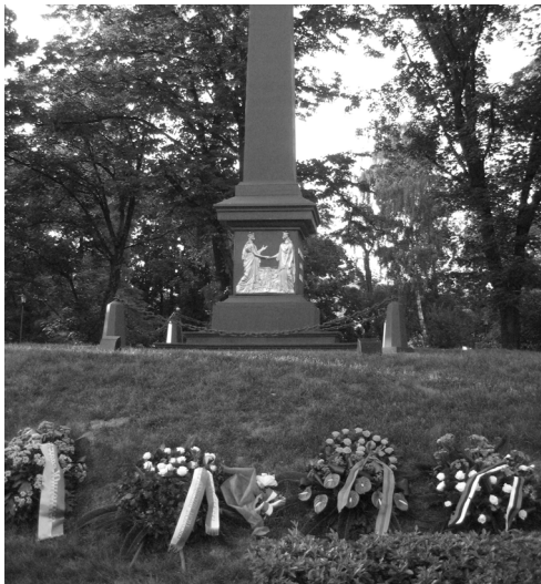
Монумент на честь Люблінської унії (Люблін, 2 липня 2009 р.)