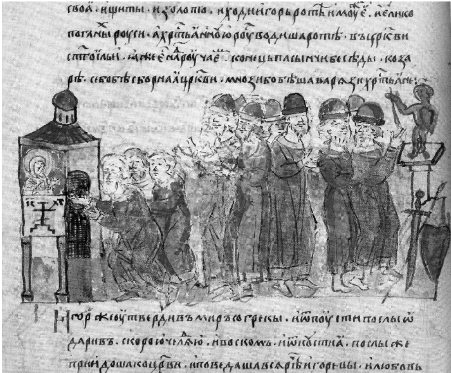
Рис. 1. Мініатюра Радзивилівського літопису із зображенням ікони Богородиці Агіосорігісі на стіні церкви. Кінець XV ст.

XV ст., ілюстрації котрого значною мірою виконанні за давнім взірцем 4 . Невідомо, чи зображення слід сприймати як півфігурне, чи його нижню частину затинає пелена (рис. 1). Ця мініатюра зображає клятву «християнської Русі» 945 р. в київській церкві пророка Іллі. Однак за сталим візантійським звичаєм на фасаді церков зображують тих, кому саме вони присв'ячені 5 ; руські художники дотримувалися традиції, доказом чого є, зокрема, ікони із зображенням Соловецького монастиря з його церквами, посвята яких означена саме в такий спосіб 6 . Отже, будь-яка випадковість тут має бути цілковито виключена.