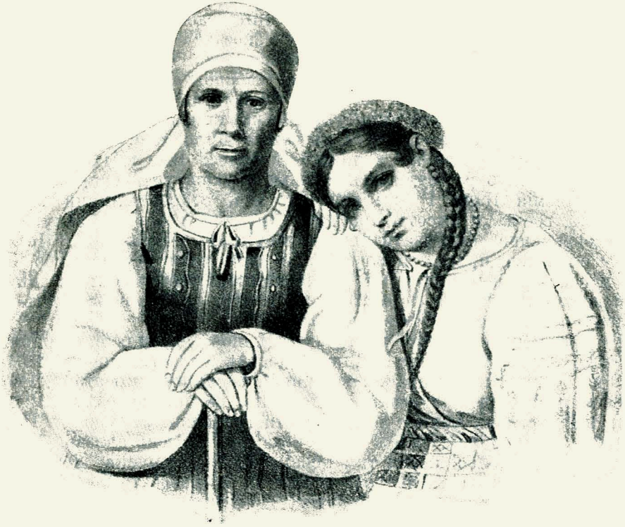
Ілюстрація з „Молодика“ за 1844 р. (натур. розмір).

та „Степ“ (1886) можна датувати закінчення „ліберальної“ ери; крутий поворот до принципів Юзефовичового „закону“ знов позначився і точився з усією лютістю аж до початку, можна сказати, нового століття.