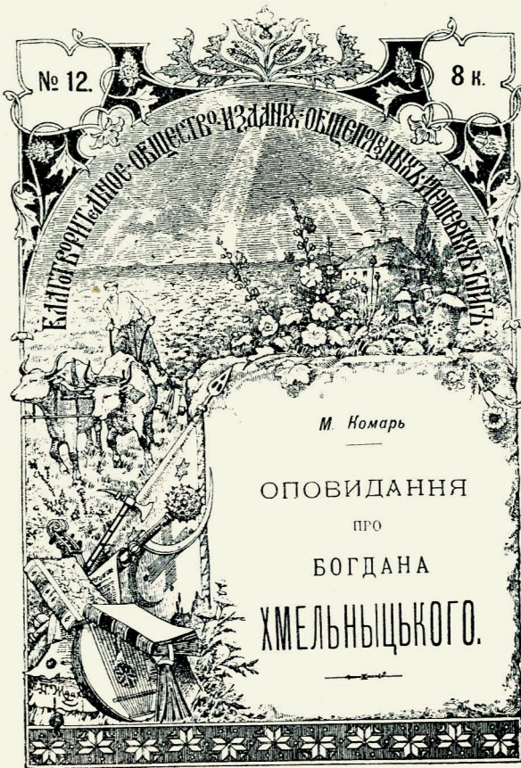
Універсальна обгортка для видань Благодійного Т-ва.

19 липня (ст. ст.) оповіщено війну між Росією та Німеччиною, а вже другого дня закрито єдину щоденну українську газету. За нею