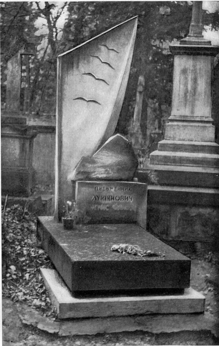
Могила Д. Лукіяновича на Личаківському кладовищі у Львові