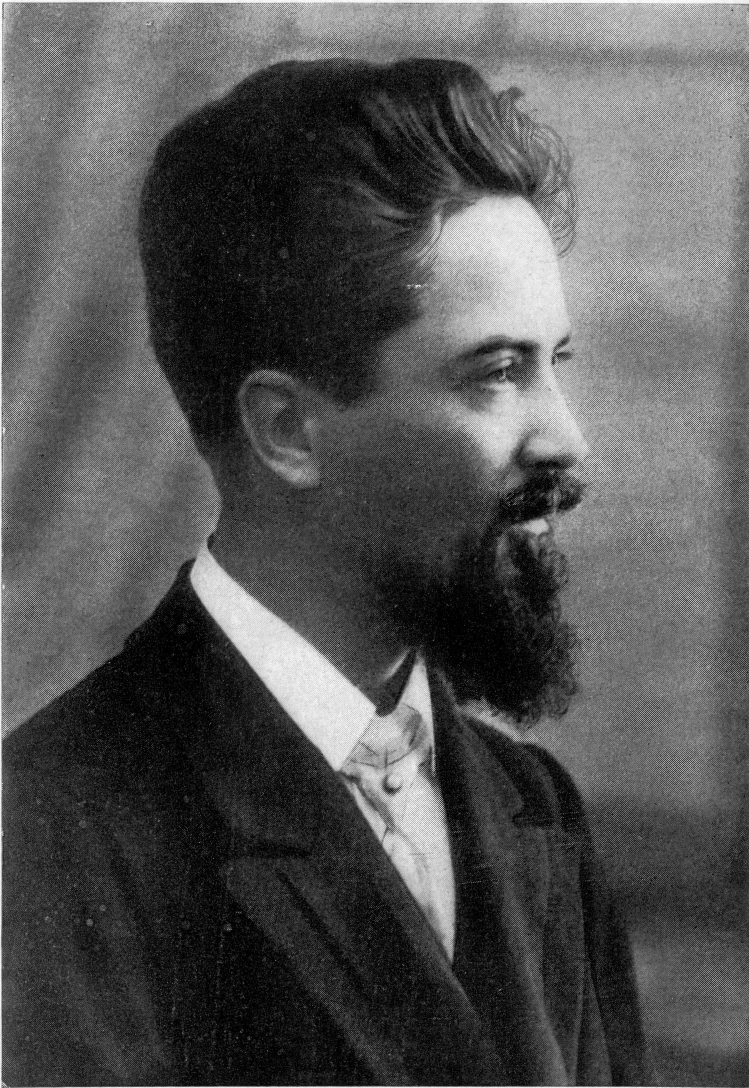
Д. Лукіянович. Фото початку 900-х років