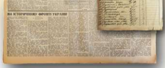
11. На історичному фоніте України