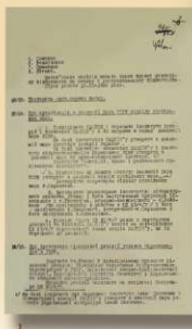
1. Стеногра промочку згодження політбюро ЦК КП(б)У від 22 лютого 1937 р. із виконанням ЦК КП(б)У "Про скасування Агінської комісії СРК Військово-учбового центру" залучені з Києва в старий науковий Інститут історії України АН УСРР