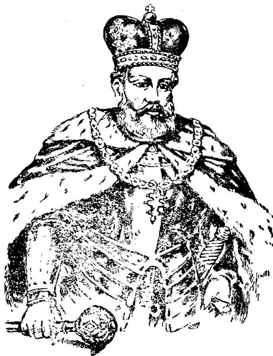
Галицький князь Лев I.

Взагалі князь Лев був розумний та рішучий володар