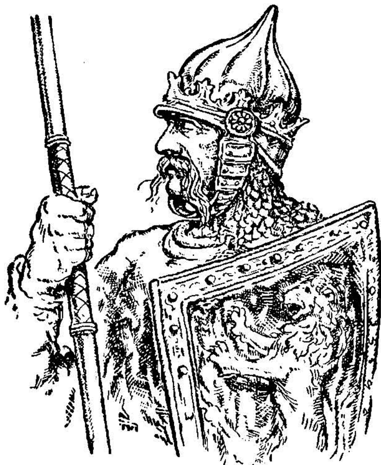
Перемиський князь Ростислав I.

упадати і тратив помалу свою давню силу і значення. Через те вже й удільні князі не дуже лакомилися на Київ, але засновували собі свої нові держави й столиці в подальших землях, на півночі й на заході від Києва, де було безпечніше.