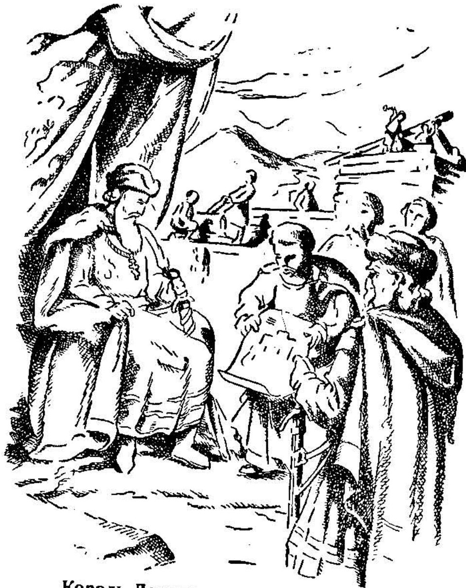
Король Данило закладає город Львів