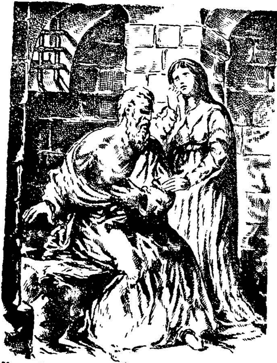
Князь Михайло Глинський у московській тюрмі