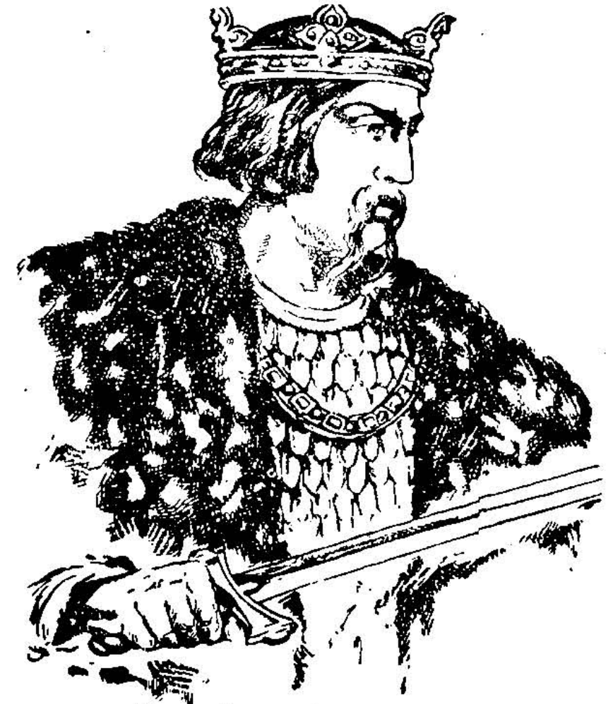
Князь Роман Мстиславич

По смерті Володимира (Ярославового сина) прийшов до Галича вже вдруге князь Роман з роду Мстиславичів. Він досі був лише волинським князем і сидів у місті Володимирі Волинським, а тепер в р. 1199-ім злучив Волинь з Галичиною і став князем великої Галицько-Волинської держави. Небаром прилучив він до цієї держави також і Київ. Там — правда — княжив князь Ростислав, але він присягнув Романові вірність та й у всьому був від нього залежний. Також чернігівських князів примусив Роман, щоб йому піддалися, так, що майже вся Україна була під його владою, а столицею став Галич, бо Київ тоді зовсім підупав. Тому літописець називає Романа „самодержавцем всеї України”.