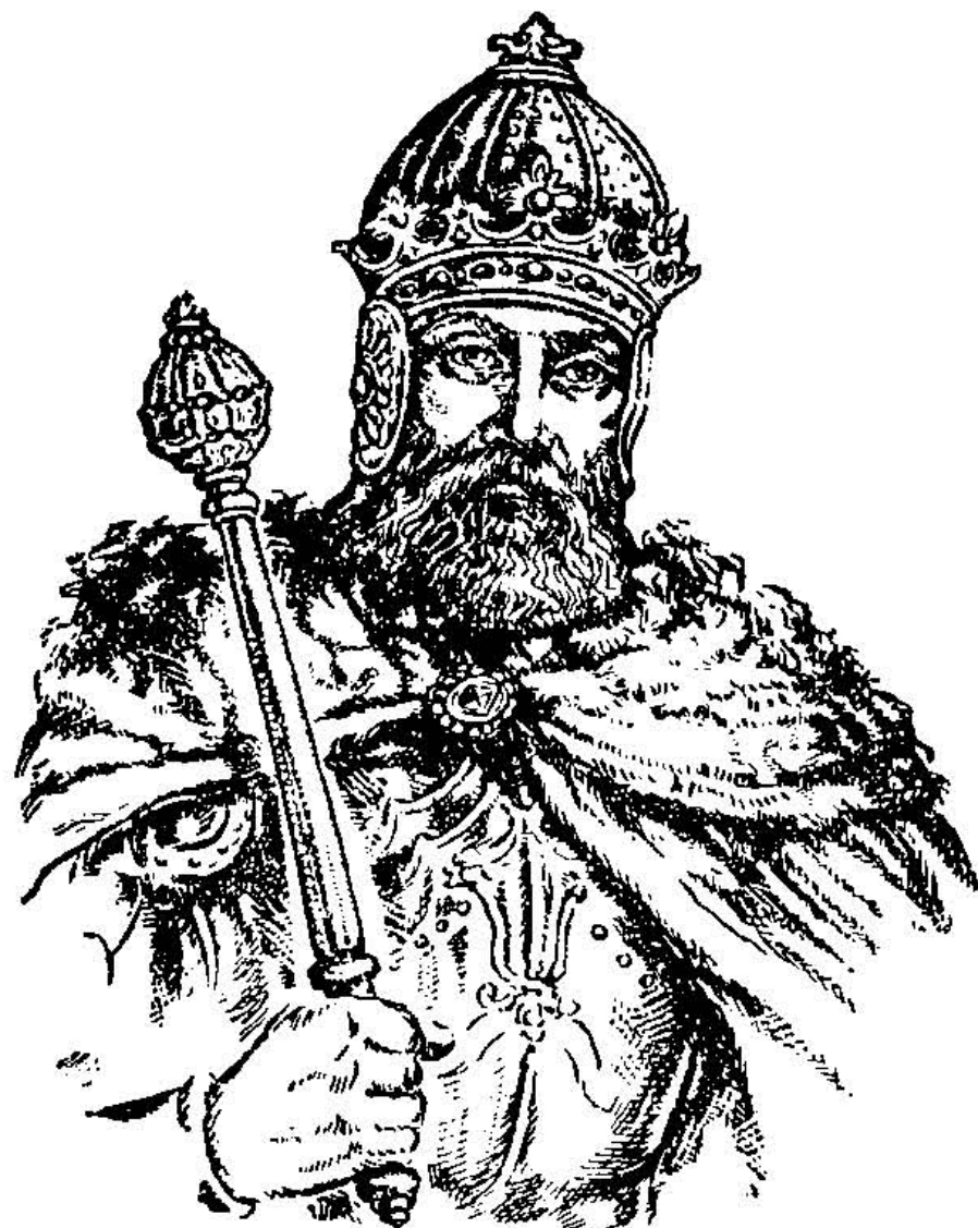
Князь Мстислав „Удатний“.

Небаром потім, в році 1228, помер князь Мстислав. За Галич почав воювати князь Данило. Йому вдалося побити всіх суперників і він став князем Галицько-Волинської держави, так, як був його батько Роман.