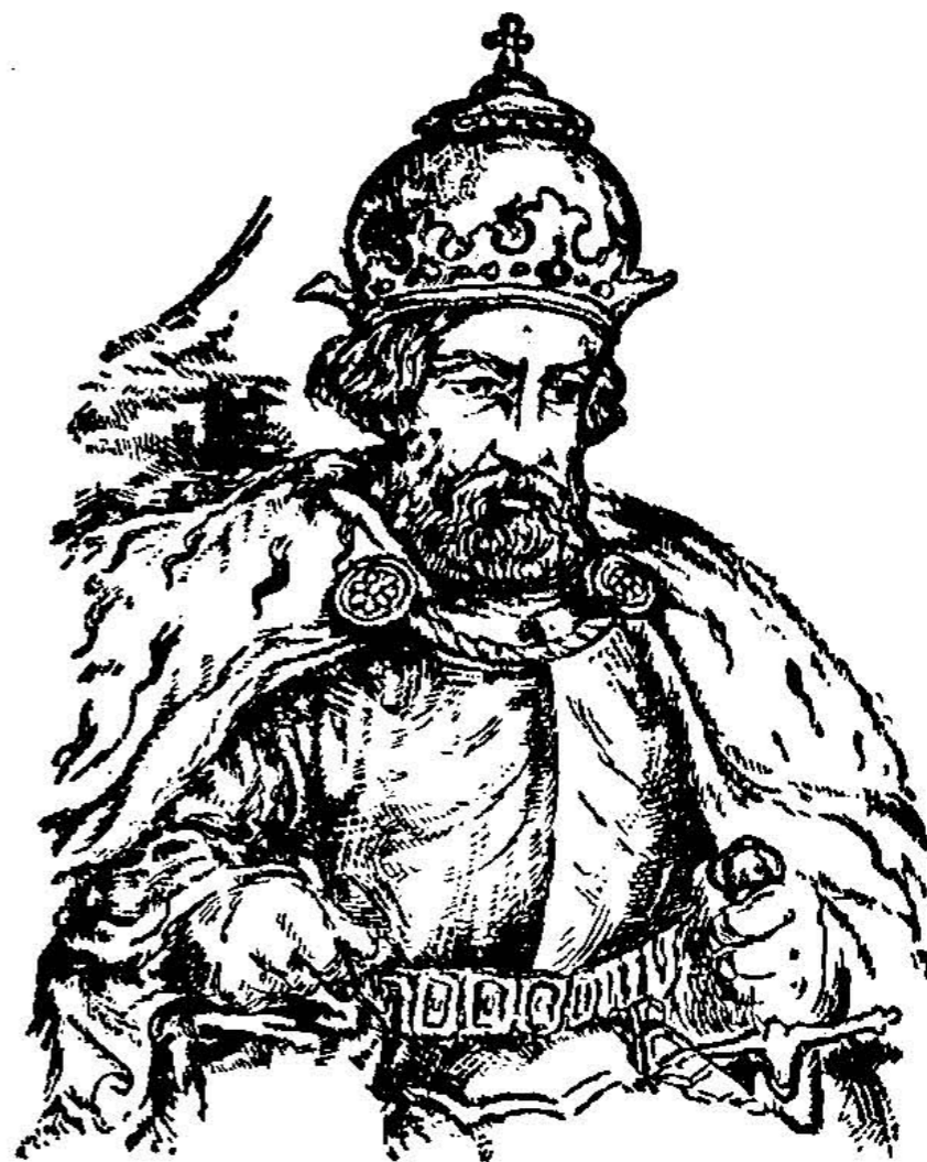
Князь Ярослав „Осьмомисл”

По Володимирові засів на галицьким престолі його син Ярослав. Цей Ярослав був дуже добрий і мудрий володар, а за його великий розум прозвали його „Осьмомислом”, то значить, що за „вісьмох” мислить. Та й говорив він вісьмома мовами: українською, польською, болгарською, грецькою, латинською, німецькою, угорською й