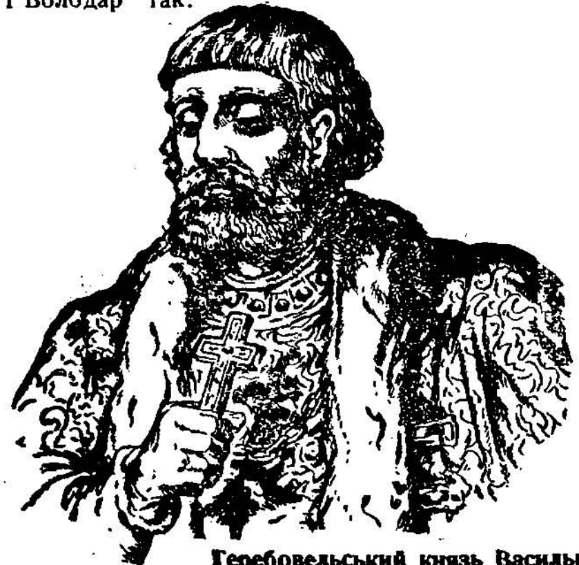
Теребовельський князь Василько.

Про осліплення Василька, про битву під Перемишлем та про братню любов згадує наш поет у вірші п. з. „Василько і Володар” так: