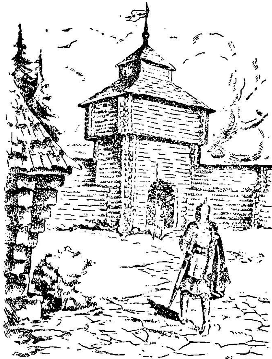
Вартова башта т. зв. „Будильниця”, яку поставив король Данило на замковій горі у Львові

З Києва пустилися татари далі на захід, на Волинь і на Галичину. Нищили і палили все по дорозі. Знищили й Галич, бо Данило мусів рятуватися втечею на Угорщину і не було кому боронити краю. Потім рушили татари на Польщу і спалили тодішню столицю Польщі, Краків, а від-