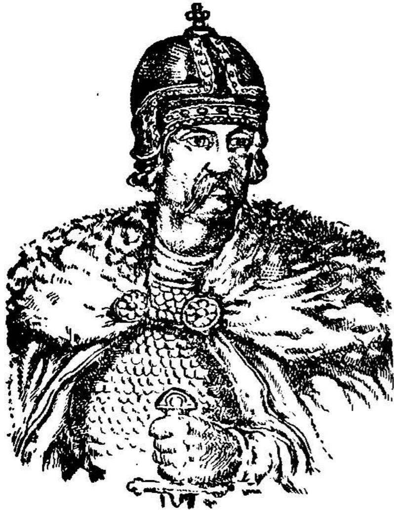
Перемиський князь Володар.