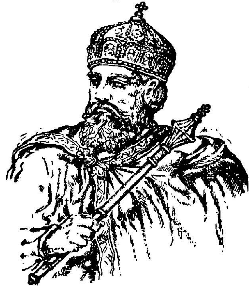
Перший галицький князь Володимирко.

в облозі, а нарешті здобув його і багато бояр покарав смертю, а Іван утік до Києва. Він тинявся ще довго потім по світі і загинув у місті Берладі, що було українською кріпостю над Дунаєм, при гирлі Прута.