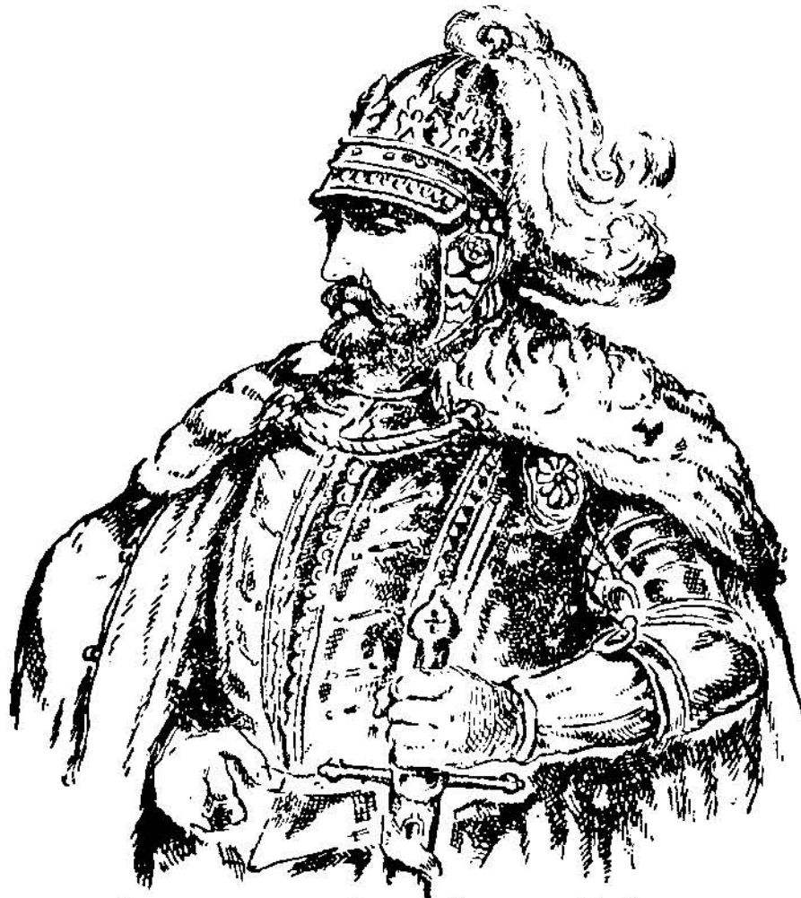
Литовсько-український князь Любарт

По смерті цього князя покликали бояри на княжий престіл литовського князя Дмитра-Любарта, що був зятем отроєного Юрія Тройденовича. Любарт почувався майже зовсім українцем, бо вже передтим жив довго на Волині, говорив лише по українськи і полюбив український народ. Під його владою була ціла Східна Галичина, Волинь та інші галицько-волинські землі.