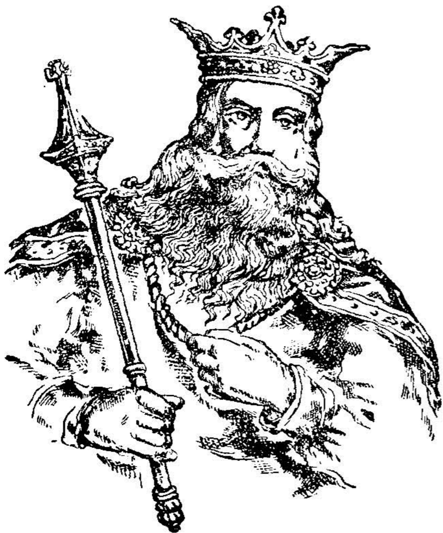
Галицько-волинський король Юрій I.

стати князем українським, — мусів прийняти православну віру і дістав хрестне ім'я Юрій. Він присягнув що буде твердо триматися української віри і звичаїв і вступив на княжий престіл у Львові, як Юрій II.