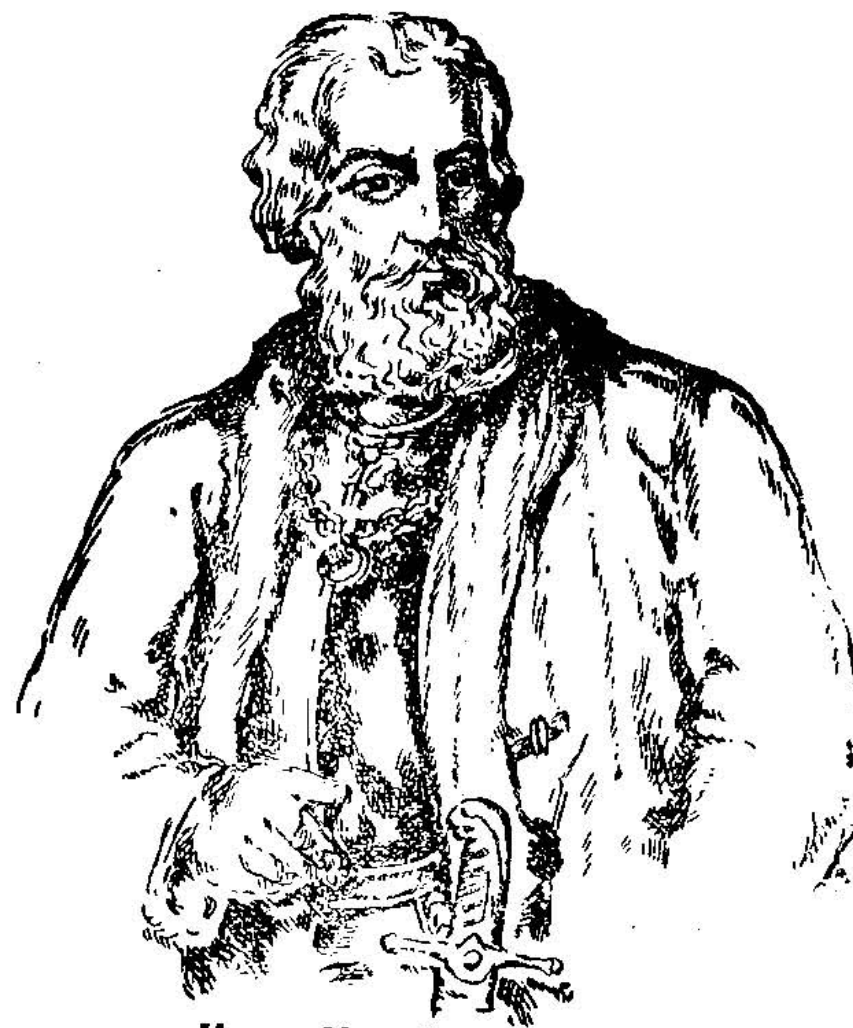
Князь Михайло Глинський

Українські князі і бояри зрозуміли, що Польща хоче тим способом взяти під свою руку Литву і всі українські землі. Тому постановили ще боронитися перед цілковитим поневоленням. Нащадок київських князів, князь Михайло Глинський, умовився з московським князем Василем III і з татарами, що він підійме повстання проти литовських князів, які вже зовсім спольщилися і гнобили Україну, а москалі й татари повинні йому дати поміч, бо коли Литва задержить всі українські землі і злучиться зовсім з Польщею, — тоді вона загрозить і Москві і татарам. Москва і татари обіцяли князеві Глинському прислати підмогу — військо і зброю. Але коли князь зібрав мале військо і виступив проти Литви (навіть деякі литовці помагали йому), то ні Москва, ні татари не прислали приобіцяної помочі. Глинського побив князь Константин Острозький під Оршою в році 1503. По програній битві Глинський утік в Москву, думаючи, що вона бодай захистить його. Але хитрий князь московський Василій III Іванович казав його увязнити й осліпити. І так Михайло Глинський згинув у московській тюрмі, на руках своєї дочки.