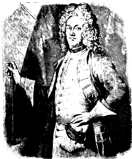
КОРОЛЬ СТАНИСЛАВ ЛЕЩИНСЬКИЙ.