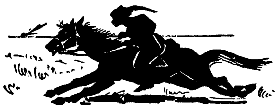
ГОНЕЦЬ З УКРАЇНИ