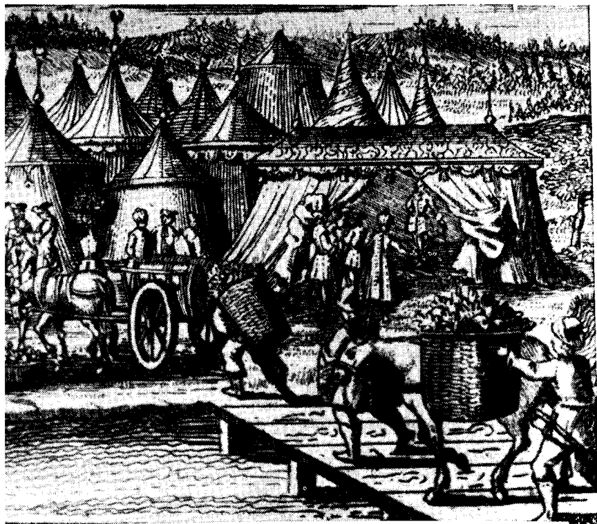
ШВЕДСЬКО-КОЗАЦЬКИЙ ТАБІР ПІД БЕНДЕРАМИ.