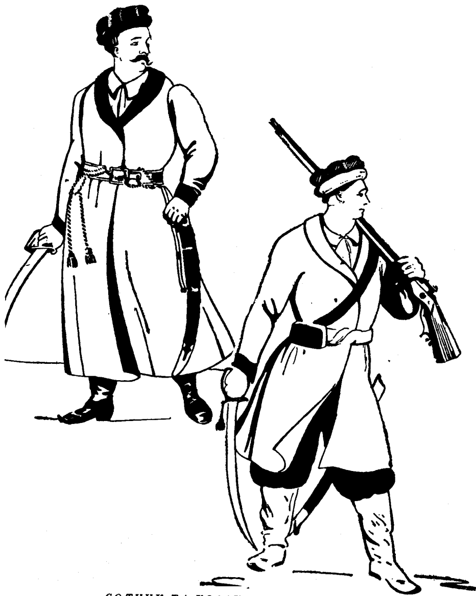
СОТНИК ТА КОЗАК ЧАСІВ МАЗЕПИ.