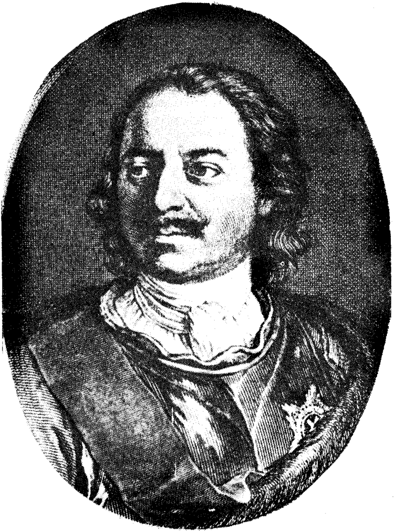
ЦАР ПЕТРО I.