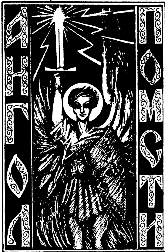
РИСУНОК ПРОФ. М. БИТИНСЬКОГО.

І новий гетьман Орлик, у відміну від свого попередника гетьмана Мазепи, розумів, що час і обставини вимагають поставлення справи визволення батьківщини в усю широту; розумів, що у великій національній боротьбі він сам, яко голова й провідник руху, має бути все ж лише виконавцем і виразником тих ідей і прагнень, що їх висловлюються найсвідомішими національно верствами українського народу.