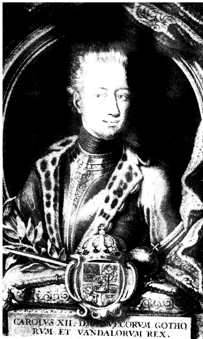
ШВЕЦЬКИЙ КОРОЛЬ КАРЛО XII.