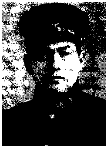
Шмідт Дмитро Аркадійович

14 серпня 1936 р. у Ленінграді було заарештовано і відправлено до Москви заступника командуючого військами Ленінградського військового округу комкора В.М.Примакова, а 20 серпня у Москві – військового аташе при політичному представництві СРСР у Великобританії комкора В.К.Путну 26 .