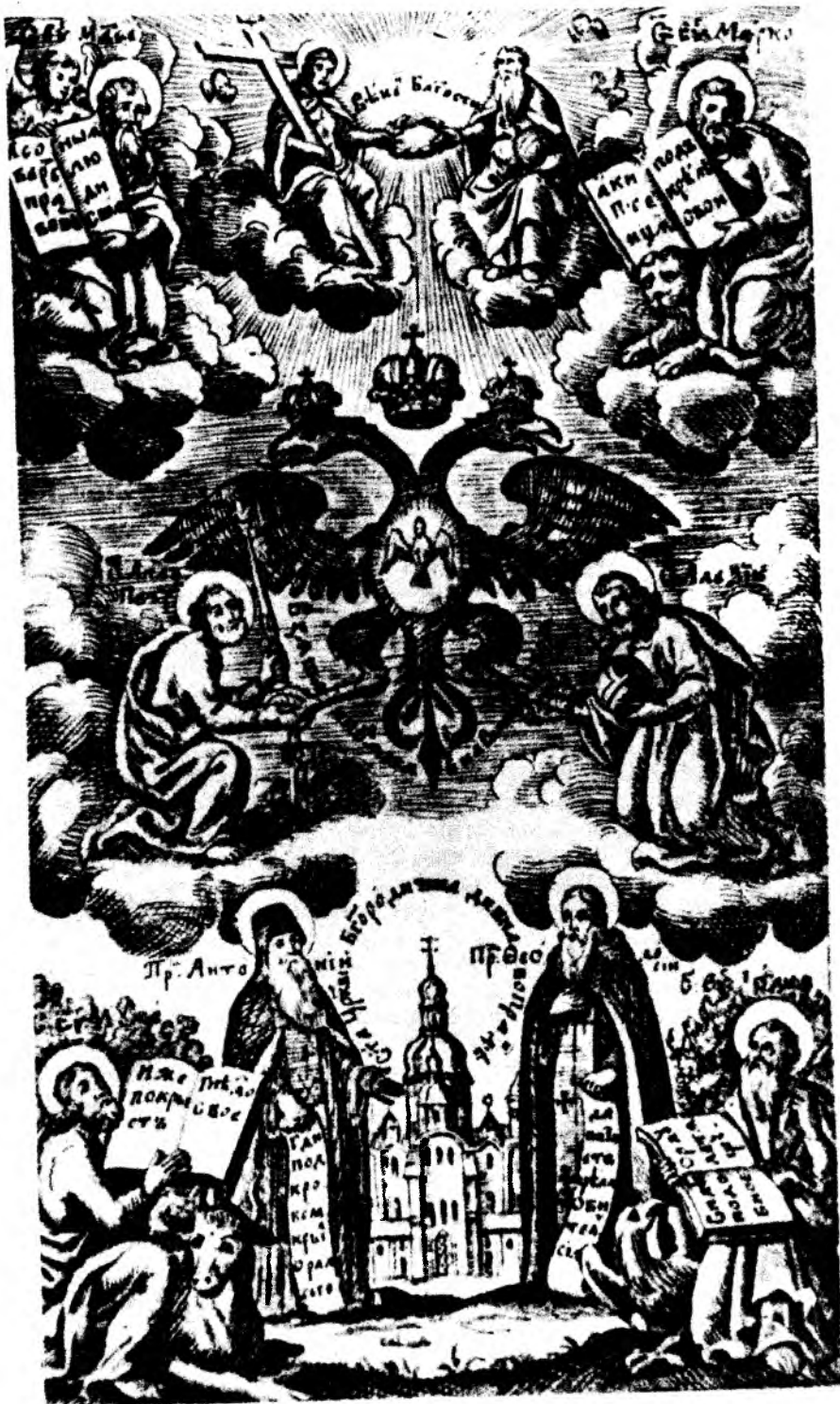
Преподобні Антоній і Феодосій