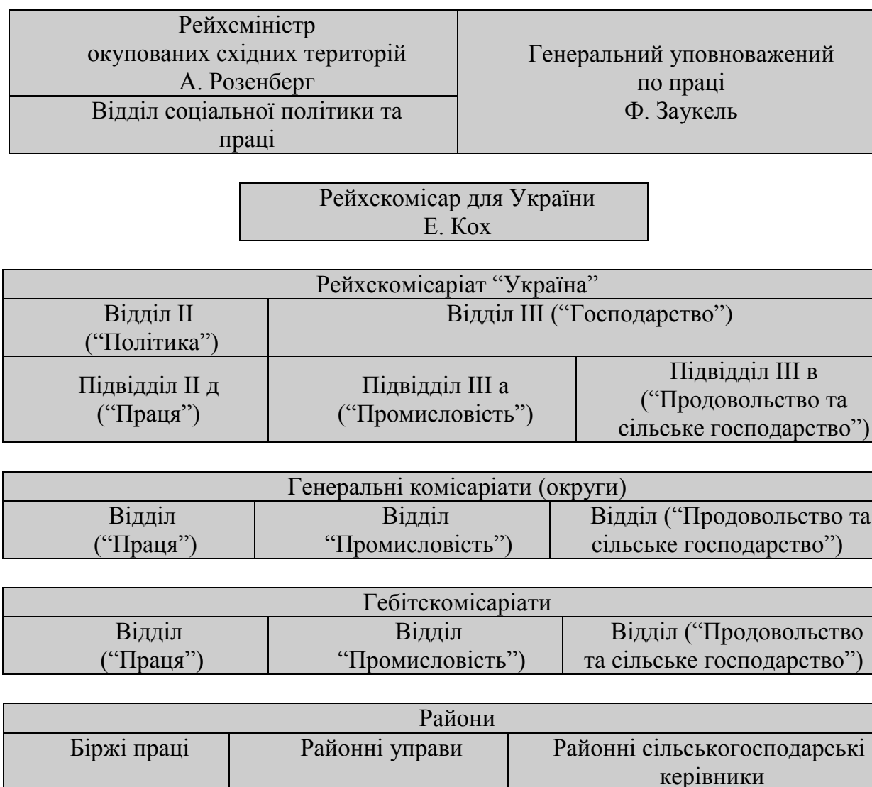
Рис. 1. Цивільні окупаційні органи управління трудовою повинністю та використанням робочої сили в рейхскомісаріаті Україна

Примітка. Схему складено автором за даними: ЦДАВО України. – Ф. 3206. – Оп. 2. – Од. зб. 25. – Арк. 6.