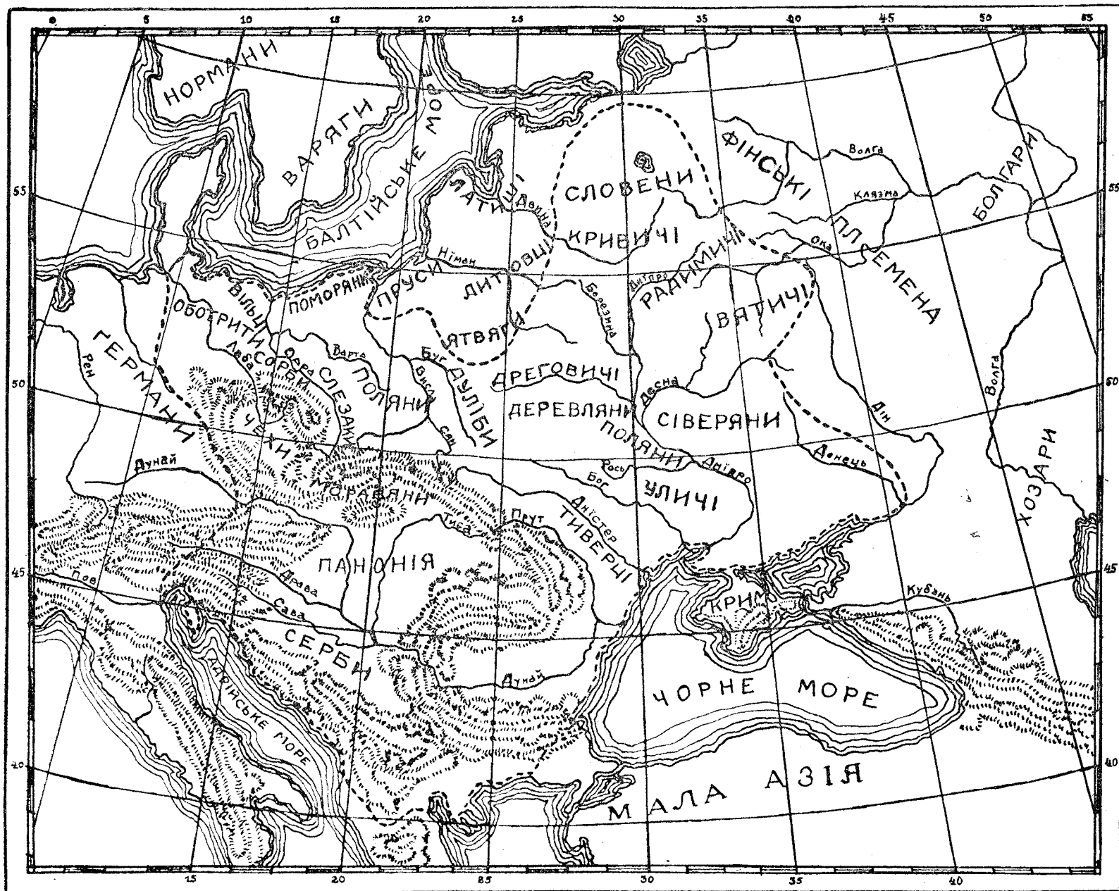
Карта розселення словянських племен в IX і X століттях.