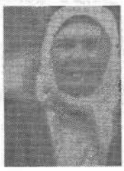
Вирок і тюремні знімки учасниць жіночого бунту в с. Новомиколаївка Скадовського району, спрямованого проти розкуркулювання і колективізації. 1930 р.