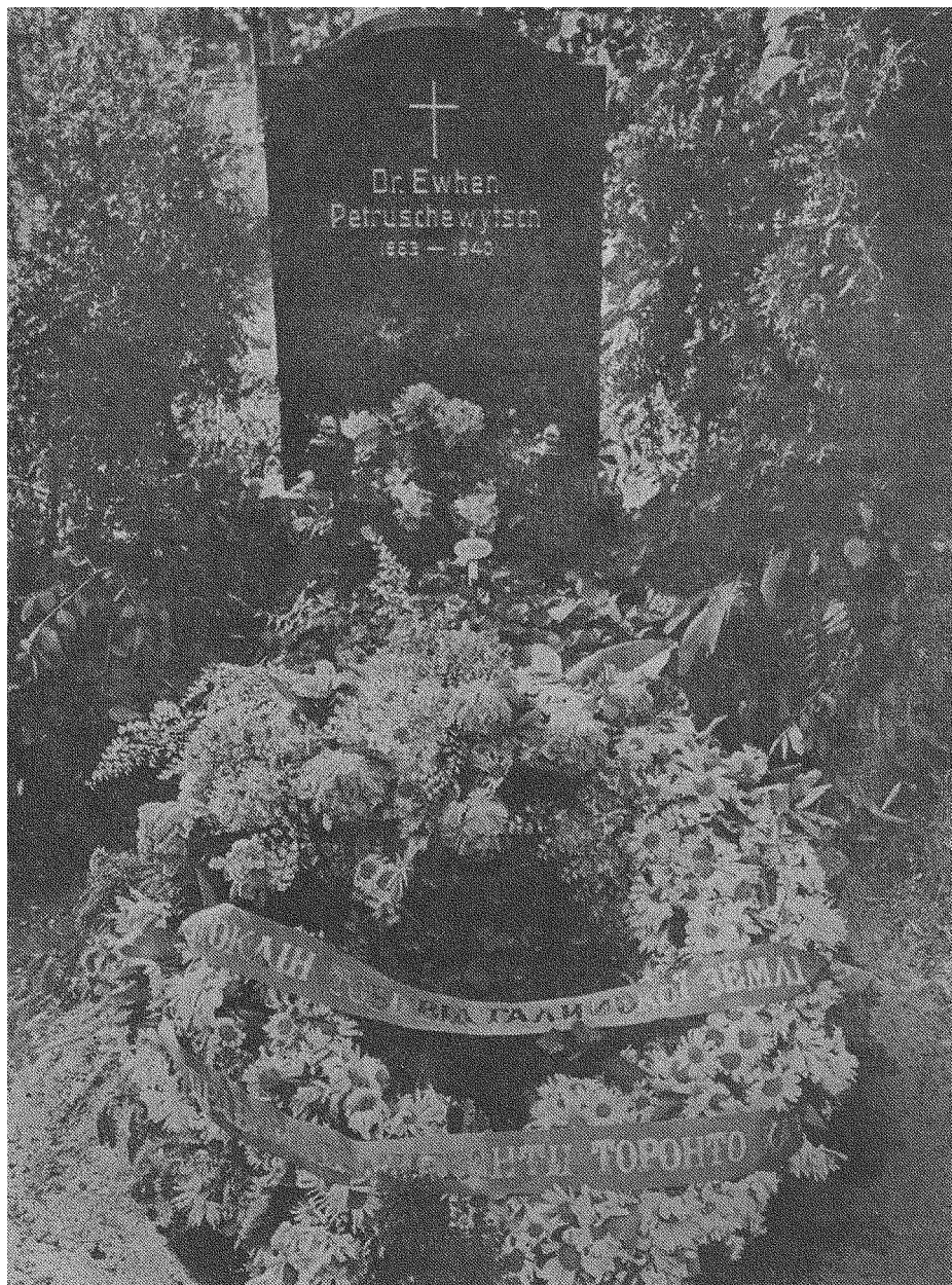
На могилі сл. п. Д-ра Євгена Петрушевича (1863 - 1940), Президента Галицької Землі, — в Берліні, Німеччина, — зложило Товариство Українців Правників Емігрантів у Торонто, через свого відпоручника, в річницю століття Його уродин, вінок з живих квітів з написом на ленті: "Поклін Тобі від Галицької Землі".