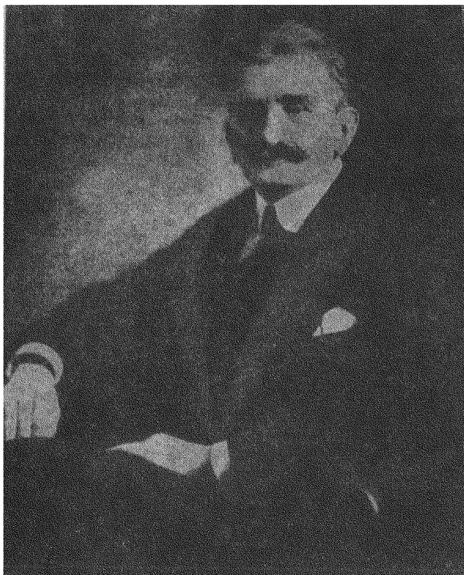
Д-Р ЄВГЕН ПЕТРУШЕВИЧ (*1863 — †1940) Диктатор і Вождь УГА, Президент ЗУНР (Галицької Держави), Головний Творець Листопадового Чину 1918 р.