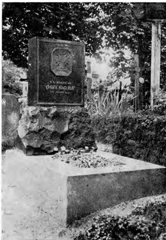
Могила Ольги Басараб у Львові