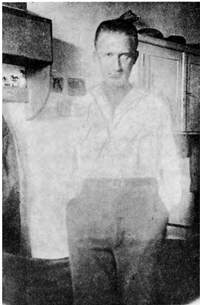
Полковник Андрій Мельник у "Бригідках"