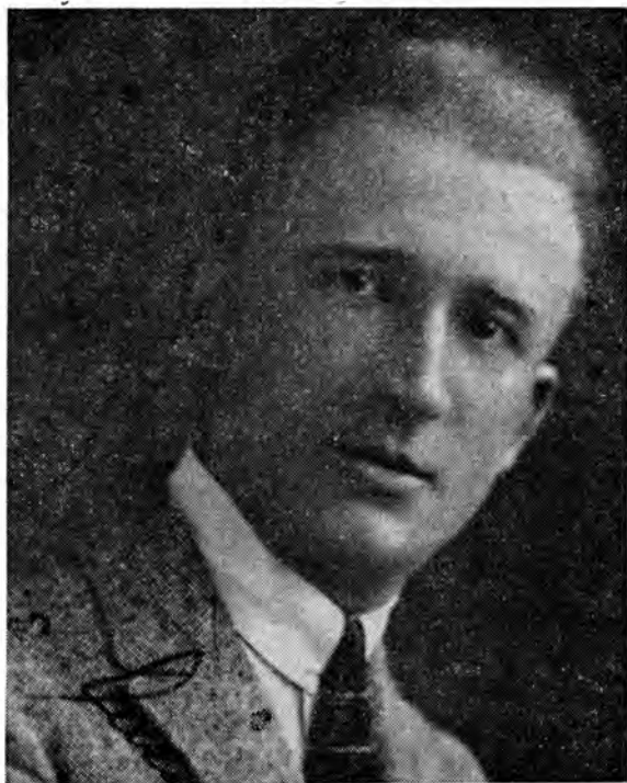
Полковник Андрій Мельник