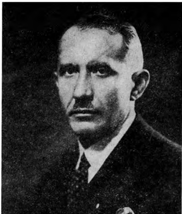
Полковник Евген Коновалецъ