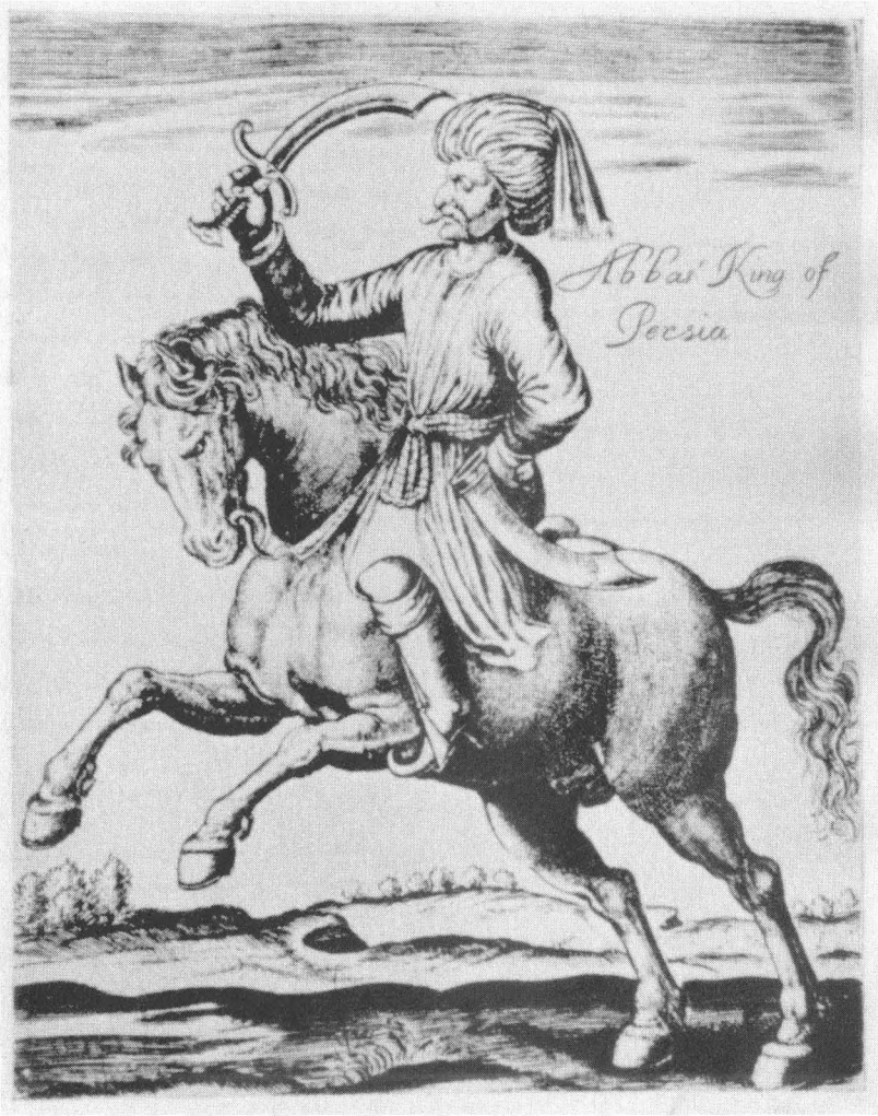
Шах Аббас Великий.