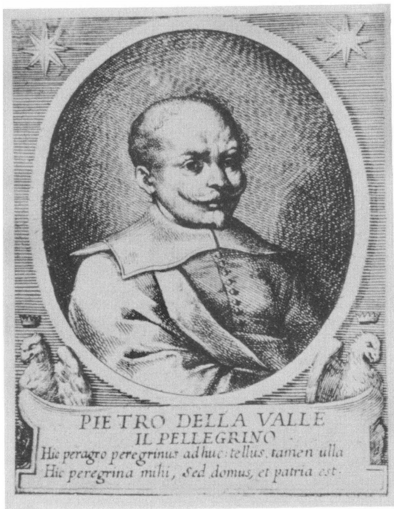
Піетро делла Валле