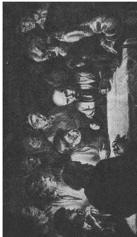
(Малюнок В. Касіяна)