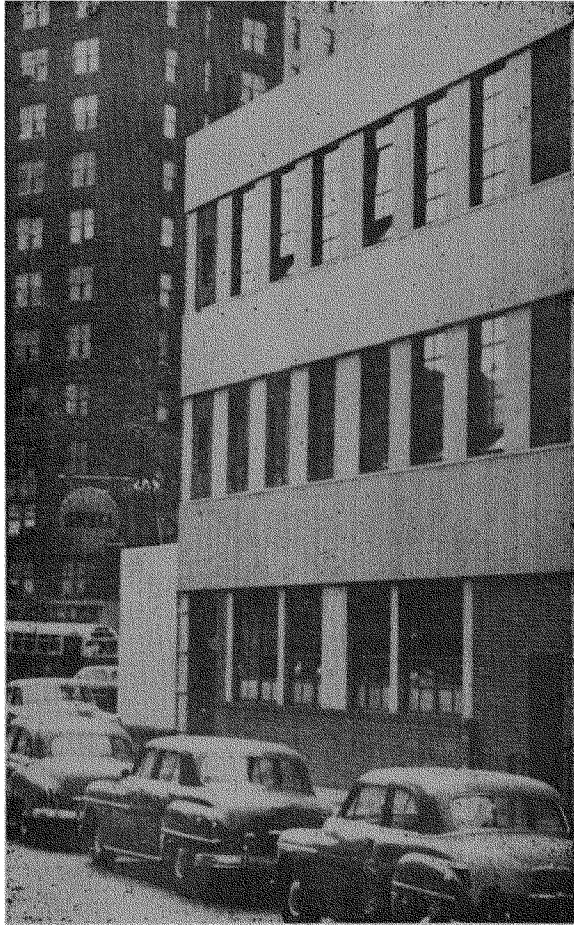
Наукове Товариство ім. Шевченка в Нью Йорку.