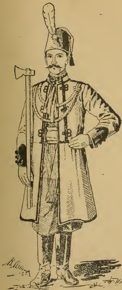
Січовик в однострою.