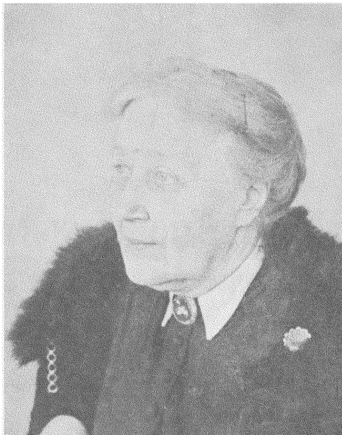
Проф. Н. ПОЛОНСЬКА-ВАСИЛЕНКО