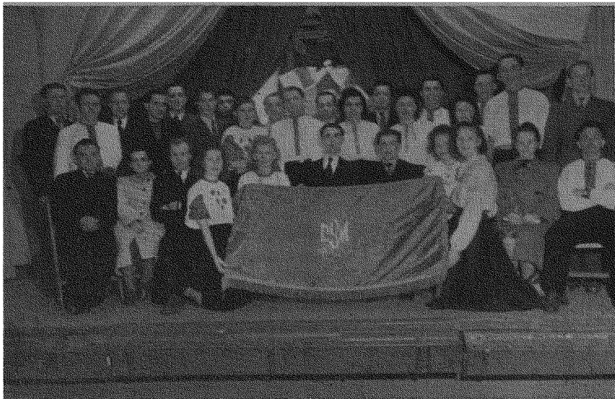
Сумівці Осередку СУМ в Чорлі з сумівським прапором.

Керуючись кличем: Б о г і Б а т ь к і - в щ и н а , мусимо плекати почуття національної гідності, тверді засади християнської моралі та повну відданість і