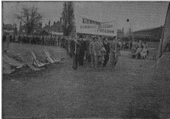
Антибольшевицька демонстрація в Бостоні.

про значення цього великого Свята. Встановивши з місць і однохвилинною мовчанкою вшановано пам'ять всіх тих, яким недовелося засісти за святочні столи в цей день.