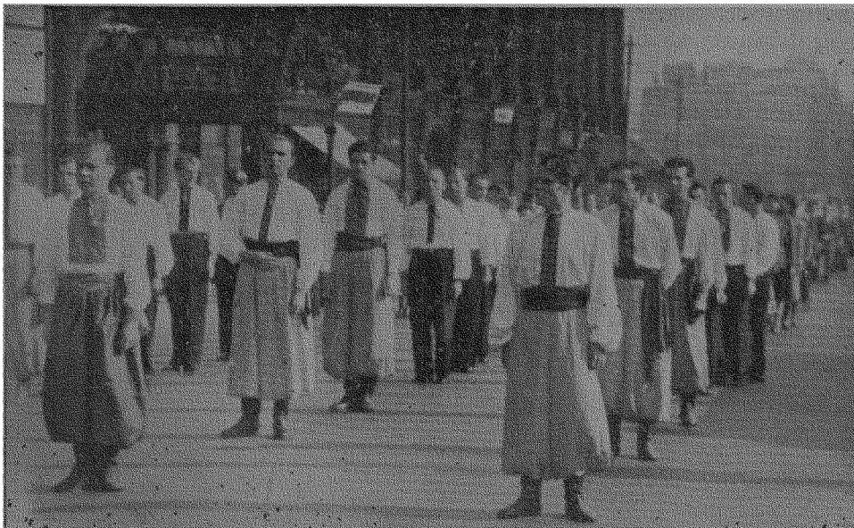
Мужеська частина української групи в похіді.