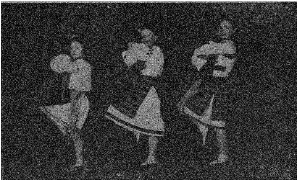
Малі танцюристки манчестерського балету „Орли“ в танку „Гуцулка“.

твердістю їхнього характеру, вірним служінням своєму народові. Признаєшся, в Тебе часто зароджувалось бажання стати і самому (ій) таким (ою). Це дуже гарно, що в Тебе виникає бажання стати прикладним (ою) у своєму житті, творити добро, набути прикмети великих і славних людей. Одначе, чи Ти зупинявся (лаєь) над тим, як дійшли ці люди до такого становища, яку працю вони