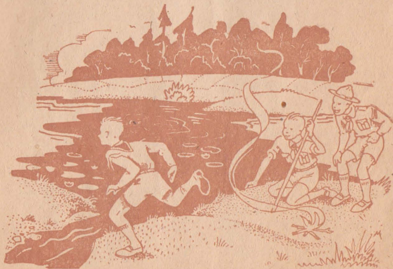
Рис. М. Михалевич