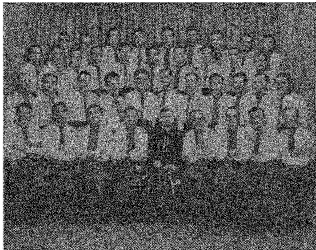
Хор Осередку СУМ в Торонті

Від осередку вийшла ініціатива створення