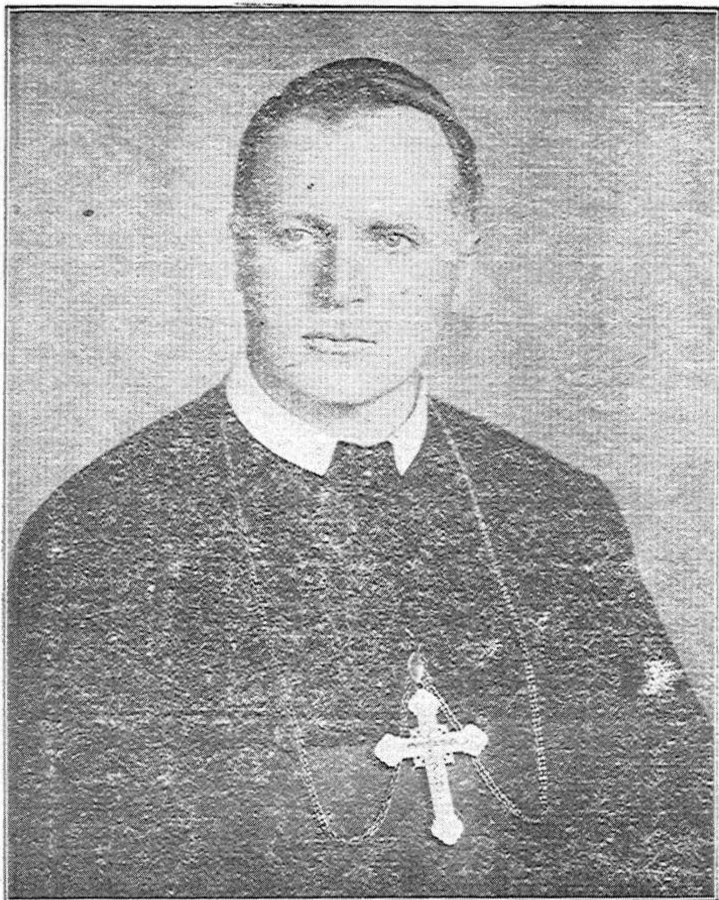
Преосвященний Кир Волод. Василій Ладика, ЧСВВ. Епископ Українців Католиків Канади