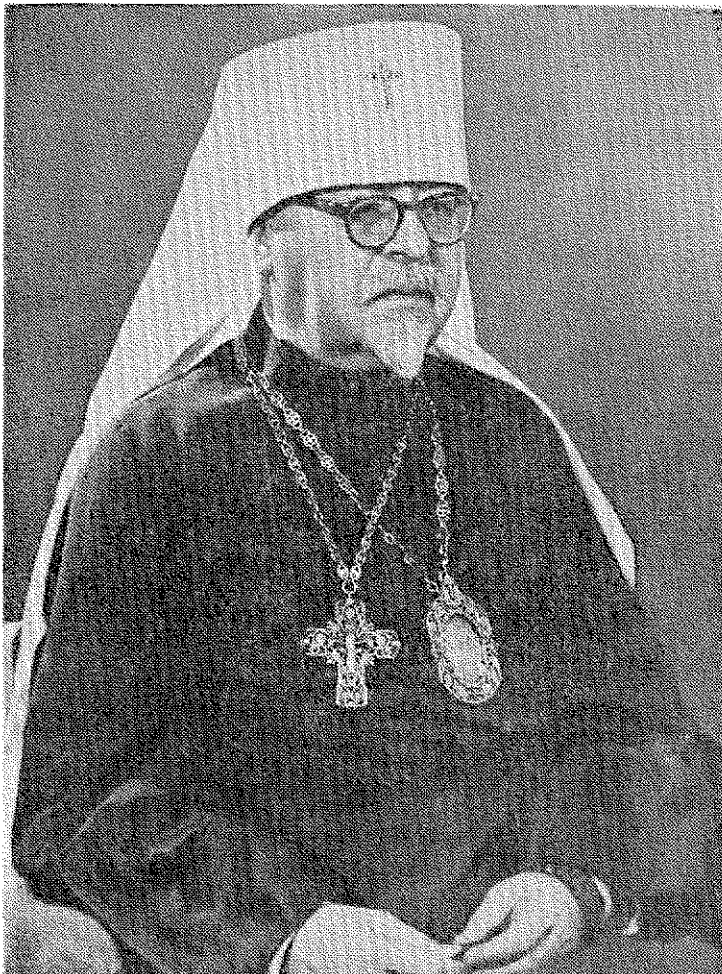
Митрополит Іларіон (Огієнко)

листопада 1941 р., бо митрополит Іларіон вище згадану коротку відповідь отримав 29 листопада 1941 року.