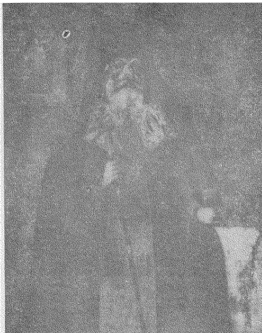
Архимандрит ЮАНИКІЙ ГАЛЯТОВСЬКИЙ церковний діяч і письменник. † 1688 р.,