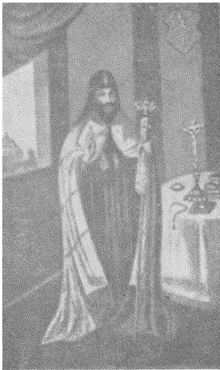
МИТРОПОЛИТ КИЇВСЬКИЙ І ГАЛИЦЬКИЙ ПЕТРО МОГИЛА (1633—1647. 1. 1.) ревний оборонець Православної Віри проти унії.