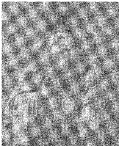
Л А З А Р Б А Р А Н О В И Ч Архиєпископ Чернігівський (1657—1693), церковний діяч і письменник.

Видатним церковним працівником за Богдана Хмельницького був також і Ла-