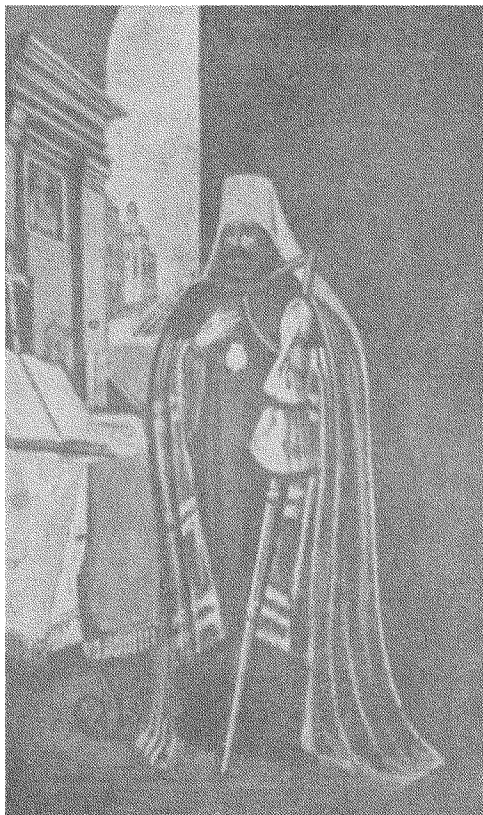
АРХИМАНДРИТ КИЄВО-ПЕЧЕРСЬКОЇ ЛАВРИ (1656—1683) ІНОКЕНТІЙ ГІЗЕЛЬ церковний діяч і письменник.