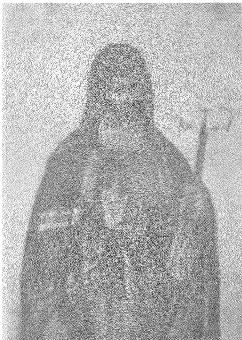
МИТРОПОЛИТ КИЇВСЬКИЙ І ГАЛИЦЬКИЙ ПЕТРО МОГИЛА 1633—1647. 1. 1.