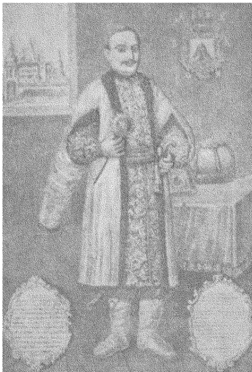
А Д А М К И С І Л Ь (1580—1653), В О Є В О Д А К И Ї В С ь К И Й (1649—1653), о б о р о н е ц ь П р а в о с л а в н о ї В і р и .