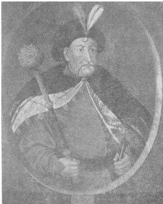
ВЕЛИКИЙ ГЕТЬМАН УКРАЇНИ (1648-1657) БОГДАН ХМЕЛЬНИЦЬКИЙ 1595 — 27. VII. 1657.

Підняв Україну в обороні Православної Віри проти унії. „УНІЯ — ДАВНЯ ПРИЧИНА ВСЬОГО ЗЛОГО В УКРАЇНІ”.