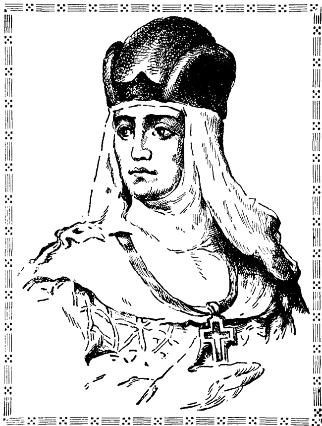
Св. Ольга, княгиня України.