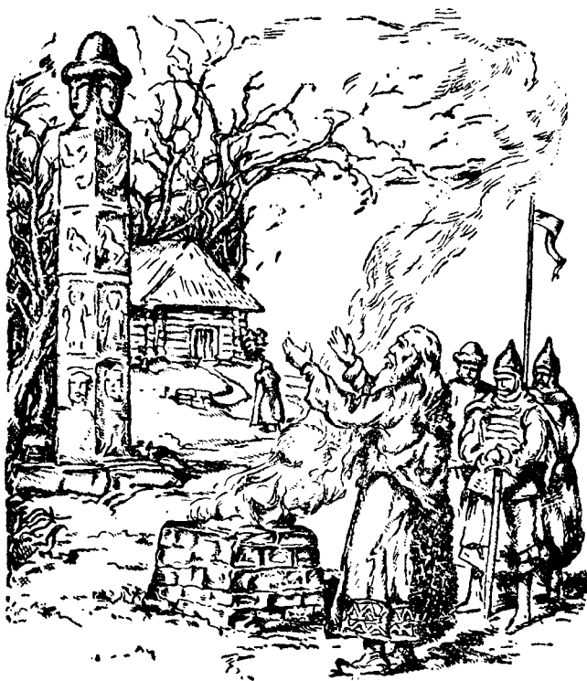
Складають жертву Дажбогові.

українські племена приносили богам криваві і безкровні жертви, щоби здобути їхню прихильність, або відвернути їх гнів. На криваву жертву приносили не тільки звірят і птахів, але й людей го-