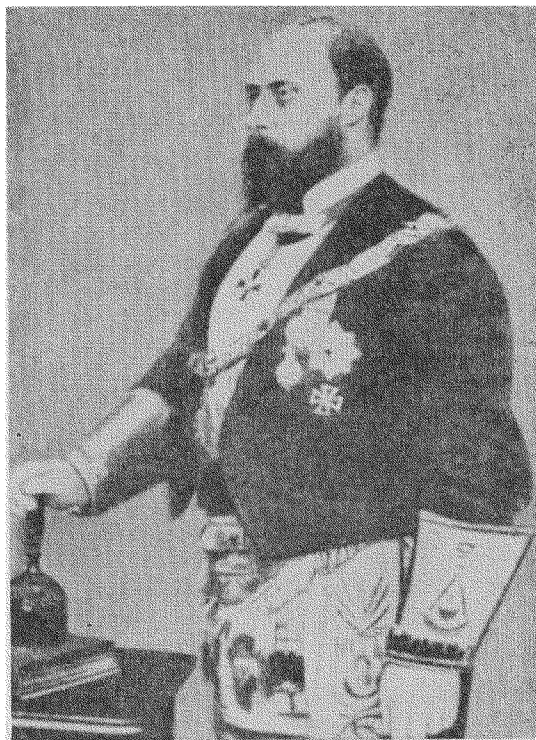
"Великий Майстер" король В. Британії Едвард VII.

"Перемога християнства була головною причиною кінця гнози. Під тиском переможної Церкви гностичні секти почали уходити кудись подалі, у провінції, в підпілля... З'явилися нові еретичні вчення, наприклад, маніхейство. Але гностицизм існував і далі, а навіть породив декілька течій — не тільки у християнстві,