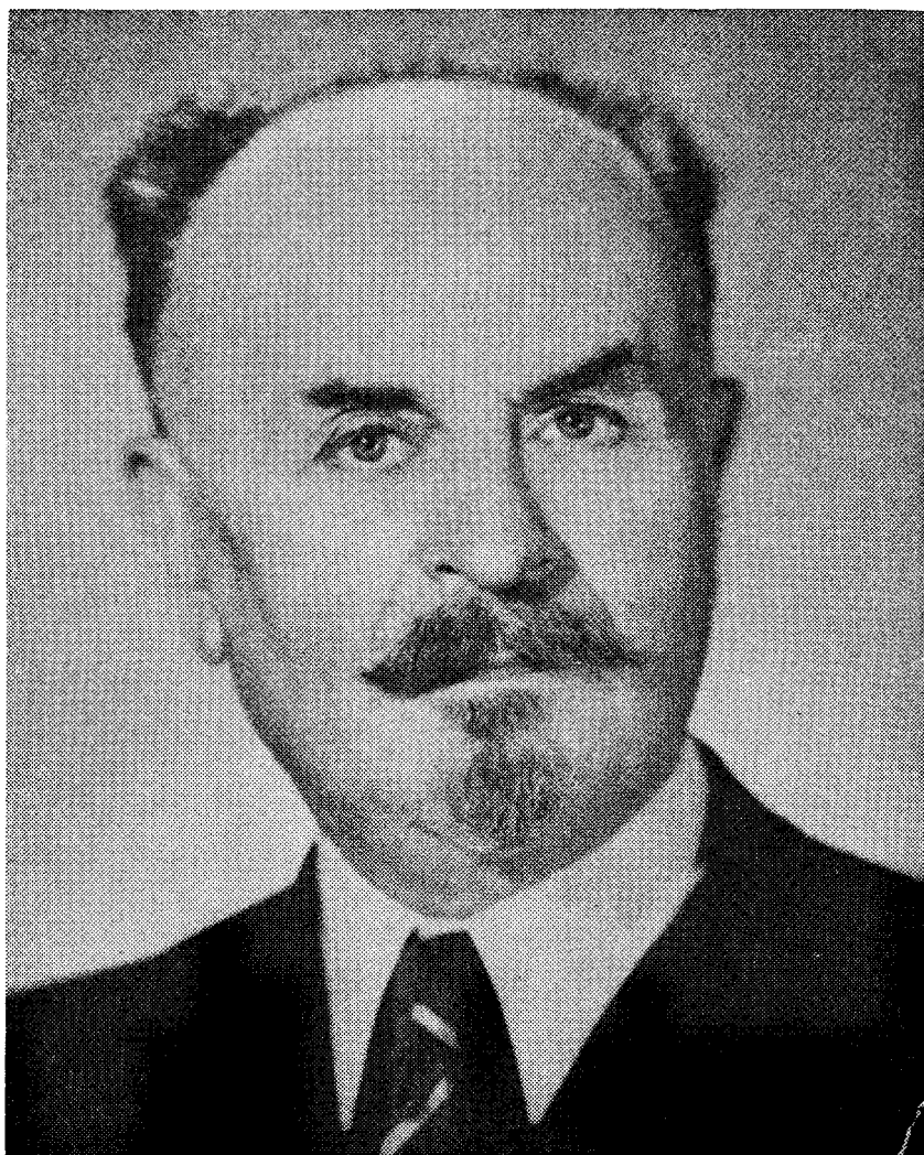
Проф. Борис М. Маргос