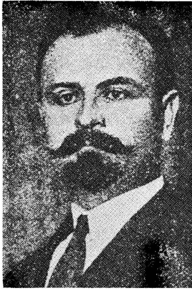
Борис Мартос (Світлина з 1917 року)