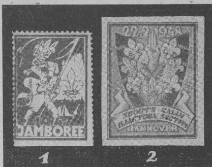
Пластові марки: 1. З нагоди Жамборее в Парижі, 2. Випуск Краєвої Пластової Старшини в Ганновері. Scouting stamps: 1 = issued on occasion of the Jamboree in Paris; 2 = issued by the Central Administration of Ukrainian Scouts in Hannover. Pfadfindermarken: 1. Ausgabe anlässlich des „Jamboree“ in Paris. 2. Ausgabe der Landesleitung der Pfadfinder in Hannover.