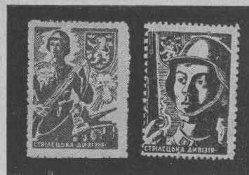
Марки української стрілецької дивізії «Галичина». Stamps issued by the Ukrainian voluntary legion „Halychyna“ (Galicia)

Після капітуляції Німеччини за межами України нашілися широкі шари українського громадянства, а саме: переміщені особи, втікачі й полонені воєнки Галицької Дивізії. Вони здебільша опинилися в таборах зорганізованих альянтською владою за національним принципом, у виняткових правних умовах, користуючися свого роду екстериторіальними управліннями. В ході організування умо-