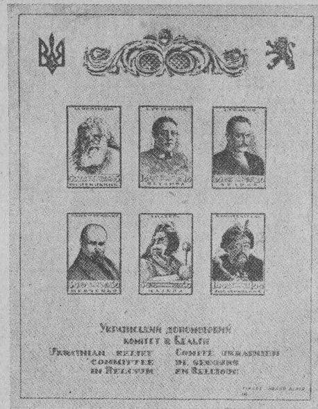
Добродійний блок УДК в Брюссель (Бельгія) Charity set issued by the Ukrainian Relief Committee (UDK) in Bruxelles. Wohltätigkeitsblock des UDK (Ukrajinskyj dopomohowyj komitet — Ukrainisches Hilfskomitee) in Brüssel.

Із цього роду випусків заслуговують на спеціальну увагу: Добродійний блок виданий Українським Допомоговим Комітетом у Брюссель «Бельгія», добродійна марка ЦПУЕ, пам'ятковий блок Українського Технічно-Господарського Інституту в Регенсбургу, виданий в 25-річчя існування цієї наукової установи, добродійна марка Санітарно-Харитативної Служби в Мюнхені, пам'ятковий блок виданий з нагоди I-го Конгресу Ліги Українських Політичних В'язнів і пропам'ятна серія Українського Допомогового Комітету в Римі, випущена в пам'ять 350-річчя Берестейської Унії.