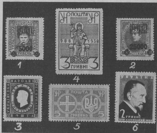
Випуски Уряду УНРеспубліки на еміграції: 1.—2. Українська Польова Пошта, 3. Пам'ятковий випуск у 10-річчя смерті С. Петлюри, 4.—5. Марка в пам'ять 950-річчя Хрищення України 6. Марка для вшанування 60-річчя народин голови Уряду А. Лівіцького.

Польова Пошта). Позатим випустив ще Еміграційний Уряд У. Н. Республіки в 1935 р. пам'яткову серію, зложену з 3-х купюр, у 10-річчя мученицької смерті Головного Ота-