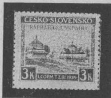
Поштова марка Карпатської України. Stamp issued in Carpatho-Ukraine. Briefmarke der Karpathenukraine.

15. березня 1939 р. тобто в дні відкриття першого Карпато-Українського Союму в Хусті, тодішній столиці країни, з'являється перша поштова марка цієї дорогої