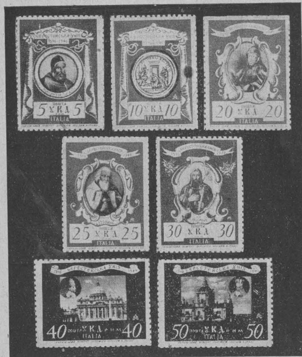
Пропам'ятна серія марок УДК в Римі. Commemorative set issued by the Ukrainian Relief Committee in Rome. Gedenksatz des Ukrainischen Hilfskomitees in Rom.

Як перша серія української пошти Державного Центру на еміграції виходить пам'яткова серія марок з нагоди відкриття I-ої сесії Української Національної Ради 16. VII. 1948 р.