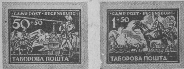
Добродійна серія таборової пошти в Регенсбурзі. Charity set issued by the camp post office Regensburg Wohltätigkeitssatz der Regensburger Lagerpost.

Велику подібність до таборових поштових випусків можна добачити у виданих 1919 р. марках бельгійських військово-полонених, що перебували у таборах Німвеген у Голландії, або для полонених англійців у німецькій таборі Руглебен або врешті для німецьких полонених у японському таборі Вандо.