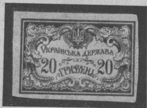
Поштова марка за 20 гривень - продовження першої обігової серії. 20-Hryvny stamps issued to supplement the first regular set. Briefmarke zu 20 Hryvny — Ergänzung des ersten Schaltersatzes

крім них ще багато різних поштових станиць, що отримали для цього окремі уповноваження, з огляду на неможливість постачати їх українізованими марками Поштових Округ. Надруки роблено ручно або друкарським способом, при чому типи тризуба не тільки в поодиноких Поштових Округах, але навіть в межах однієї Округи були різноманітні, наслідком чого маємо величезне багат-