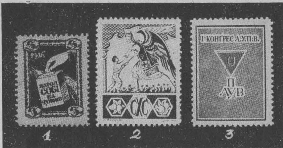
Приватні випуски: 1.—2. Добродійні марки СХС, 3. Марка з пам'яткового блоку ЛУПВ.

Private issues: 1—2 = Charity stamps issued by the Ukrainian Sanitary Board; 3 = Sample from the commemorative set issued by the League of Former political Prisoners.