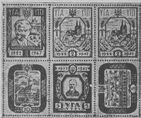
Пам'ятковий блок УТГІ в Регенсбургу. Commemorative set issued by the Ukrainian Technical College Gedenkblock des Ukrainischen Technisch-Wirtschaftlichen Institutes in Regensburg.