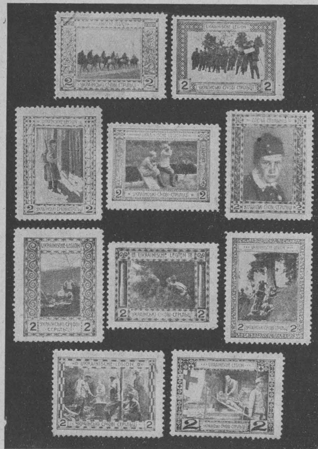
Марки Легіону Українських Січових Стрільців. Stamps of the voluntary Ukrainian legion. Marken der ukrainischen Schützenlegion.

проте широко розповсюджені на поштових посилках, цілком виконали своє пропагандивне завдання, з'ясовуючи перед світом ідею визвольних змагань українського народу.