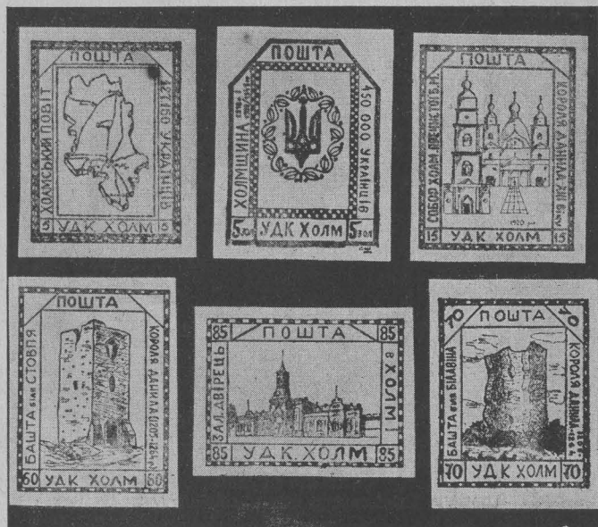
Службові марки Українського Допомогового Коомітету в Холмі. Special stamps issued by the Ukrainian Relief Committee in Cholm. Dienstmarken des Ukrainischen Hilfskomitees in Cholm.

службових марок для внутрішнього поштового вжитку Українського Допомогового Комітету в Холмі та дві марки української дивізії «Галичина», виконані за проектом