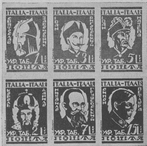
Серія володарів України видана табором полонених вояків у Ріміні.

Купюра за 100 шагів, що закінчує серію поштових марок Української Національної Ради, документує зображенням декларації УНРади, останній хронологічно, державний акт в історії українського народу, на порозі його близького визволення. Декларація Української Національної Ради є виявом державницької думки української еміграції, що об'єдналася в єдиним Державним Центрі для осягнення найвищої мети наших невинних змагань: створення Самостійної Соборної Української Держави.