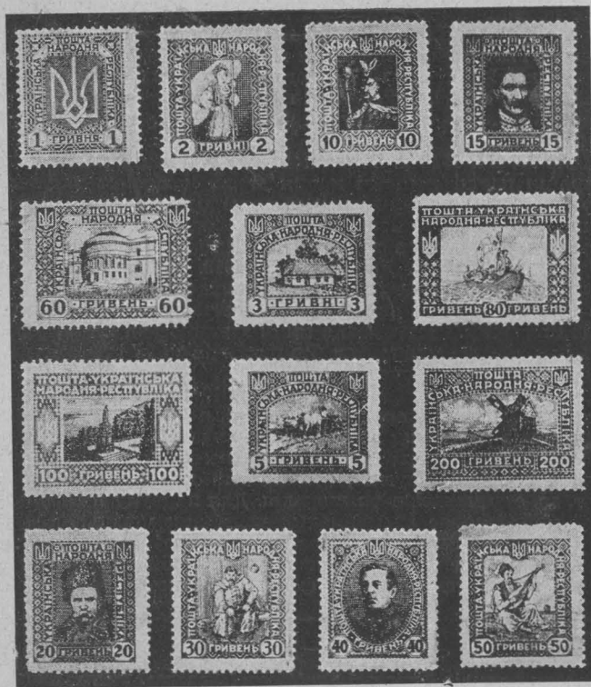
Серія поштових марок, друкowana у військовім географічнім інституті у Відні. Set of stamps printed at the Militärgeographisches Institut at Vienna. Briefmarkensatz, gedruckt im Militärgeographischen Institut in Wien.

В грудні 1919 виходить на замовлення українського уряду, у військовім географічнім інституті у Відні, серія поштових марок, зложена з 14 купюр. Її рисункова тематика — це державний герб, будинок Центральної Ради, історичні портрети та типові краєвиди і сцени українського побуту. Ця серія не була вже віддана для поштового вжитку, з огляду на большевицьку окупацію України та виїзду Уряду Української Народної Республіки на чужину.