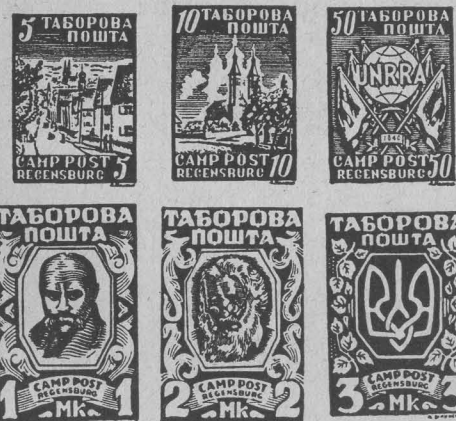
Марки таборової пошти в Регенсбургу — обігова серія. Stamps issued by the camp post office Regensburg — regular set. Marken der Regensburger Lagerpost — Schaltersatz.

вин щоденного побуту налаштовано в таборах, між іншими інституціями публичного характеру, теж поштові станиці, для обслуговування мешканців внутрі табору та в їхніх поштових зв'язках із зовнішнім світом, при чому