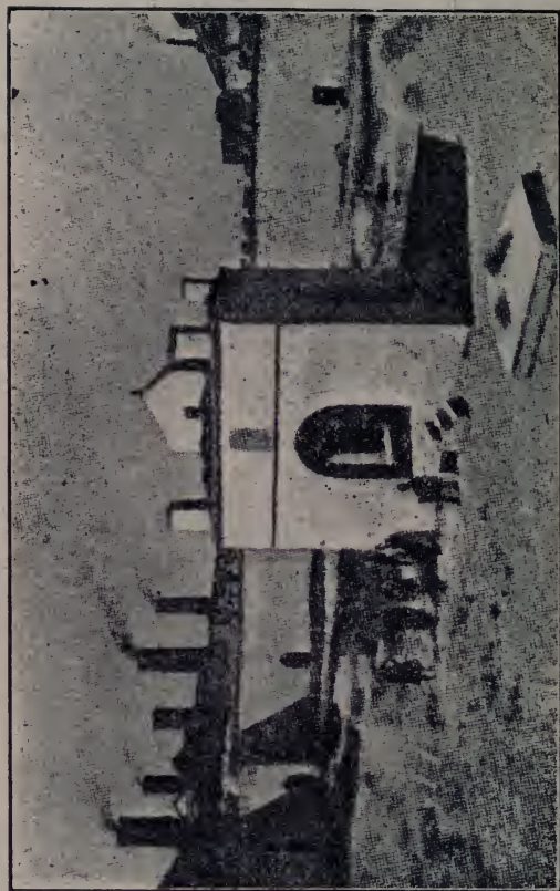
Обр. 6. Теперішня святиня огнепоклонників.

симі огні. Сама середина храму, де під високою копулою стояв священничий вівтар, вся була огорнена полумінею. Нічю огні ті озорядили сумну пустинну околицю і при їх світлі від