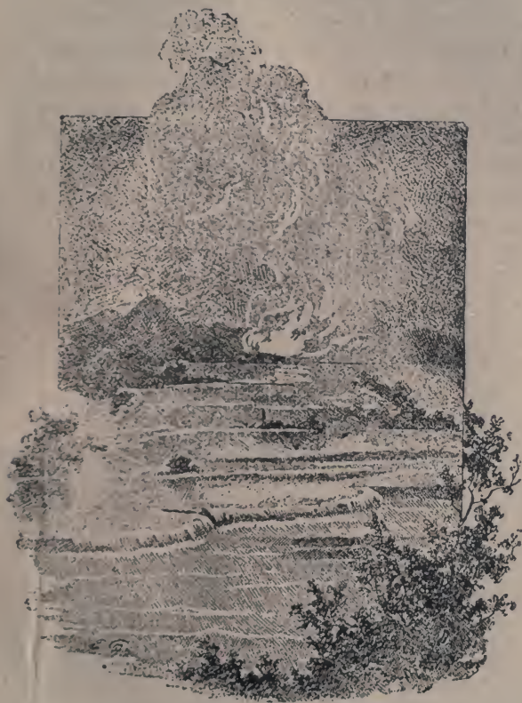
Обр. 2. Озеро Ротома хана з жерелом Тетарата.

воно представляє собою найчуднійше явище в тій дивній країні. Головний водозбір жерела лежить на склоні горбка покритого папоротю, стіни водозбірника, з червоної, на пів-