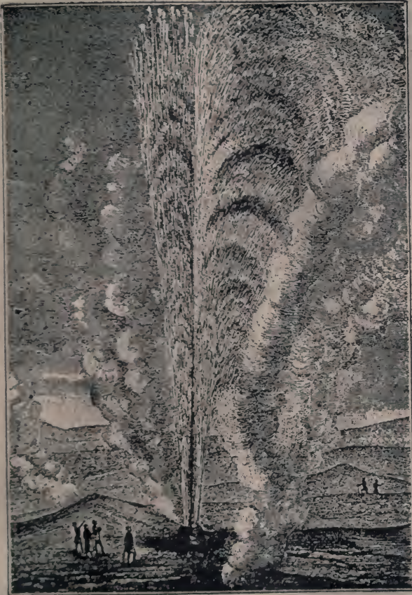
Обр. 4. Гайзер "Улей".

з околичних височин ви вже бачите "верхню кітловину гайзерів", поражуючи безконечним