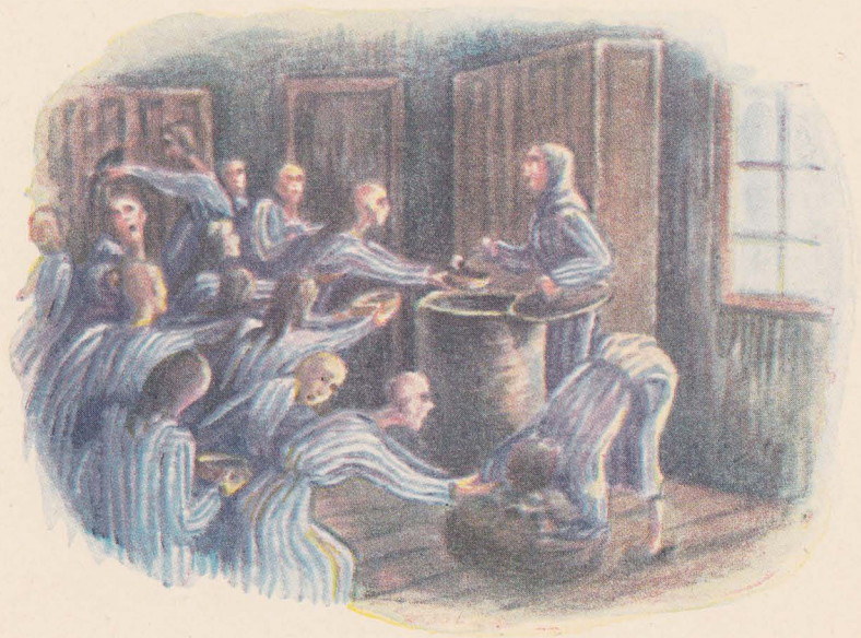
Обід — пісна юшка з води й лущиння картоплі.