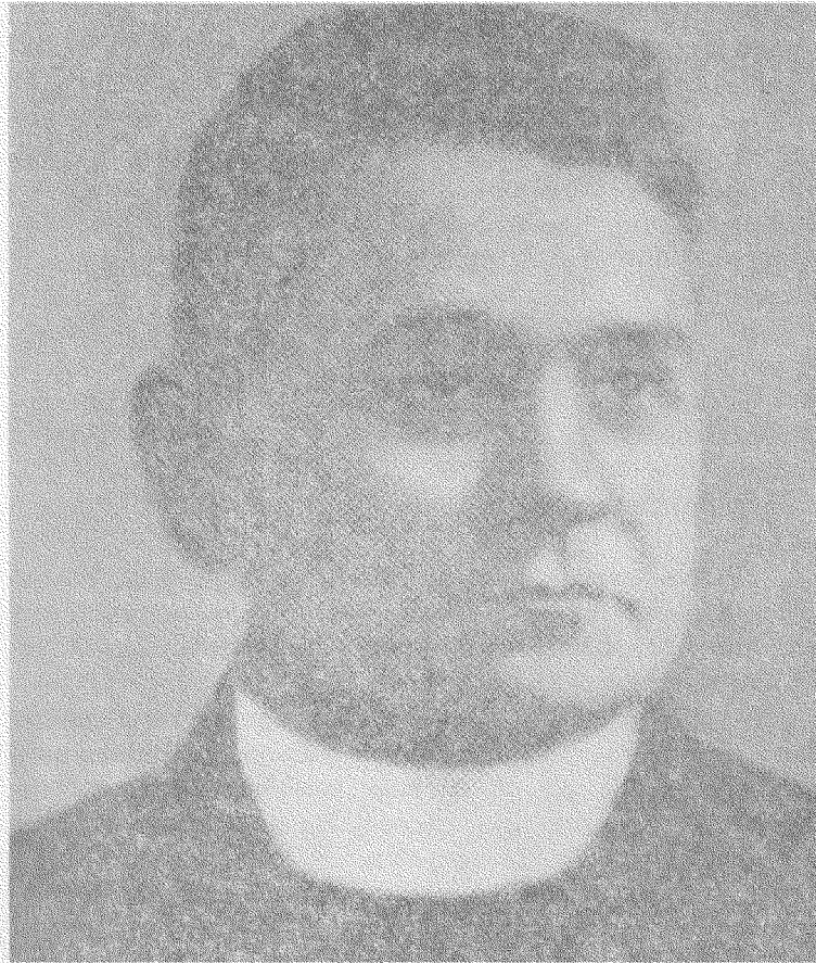
о. д-р Гавриїл Костельник

нар. 1886 у Бачці (нині Югославія). Письменник, публіцист, філософ-богослов, поет, викладач (1920-28) у Гр.-кат. Духовній Семінарії у Львові, ред. „Ниви”. Автор: „Християнство і демократизм”, „Три розправи про пізнання”, „Нарис християнської апологетики”, „Спір про епikleзу між Сходом і Заходом”, „Засади тотожності” (нім. мовою), „Становище і походження людини” та інші.