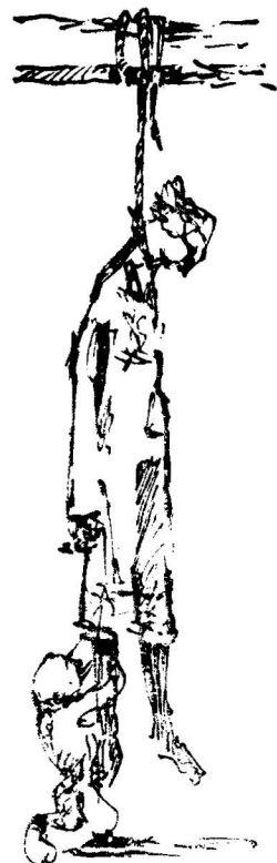
І повисло тіло В сінях, на бантині.

— Мамо їсти! Мамо! Тіло, як лозинка, У очах блакитних — Глибина озер. — Сину мій коханий, Бідолашний синку, Ось приїде тато, Хліба привезе... А у тата птиці Виклювали очі, І мішок порожній Порохом припав. Десь аж на Кавказі, Коло міста Сочі, Напоровсь на кулі Сталінських застав. Стерегли дорогу Люди — вовкулаки. «Завертай голодних. Звідкіля прийшли!» Скільки їх лишилось В приміських байраках — Молодих і сивих Нуждарів землі! Наварила юшки