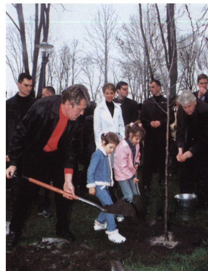
Во время акции «Зеленый росток будущего». 19.04.2005