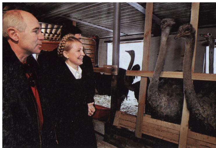
На страусиной ферме в Черкасской области. 20.12.2005