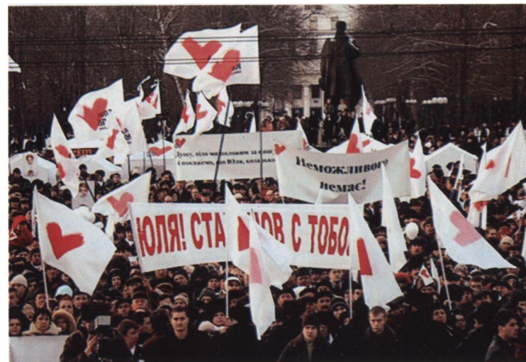
Луганск встречает Ю.Тимошенко. 24.03.2006.