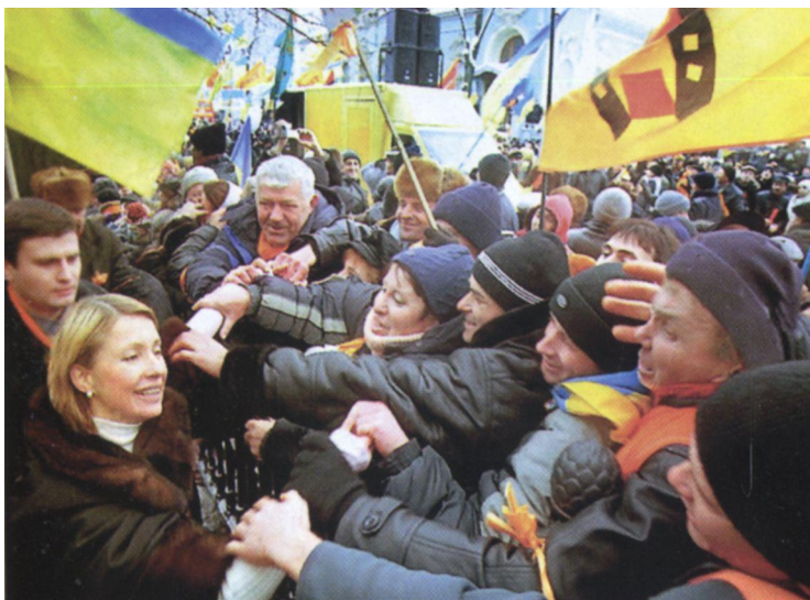
Встреча Ю. Тимошенко с участниками «оранжевой» революции возле Верховной Рады Украины. 16.12.2004