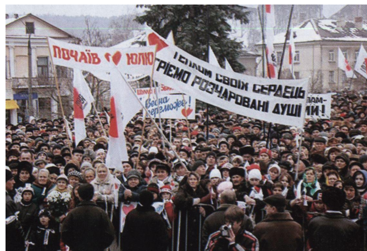
Жители Тернопольской области на митинге в поддержку Ю.Тимошенко. 18.03.2006