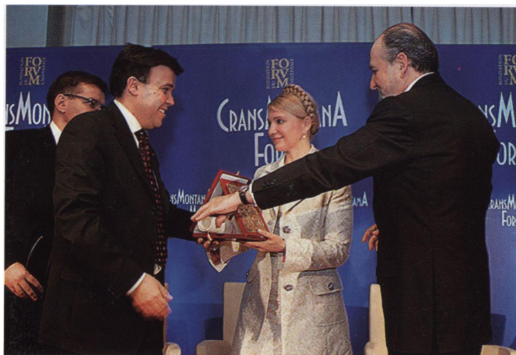
Вручение Ю. Тимошенко награды Prix de la Fondation на Евросредиземноморском форуме в Монако. 9.12.2005