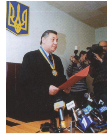
Оглашение решения суда об освобождении Ю. Тимошенко. 1.03.2001