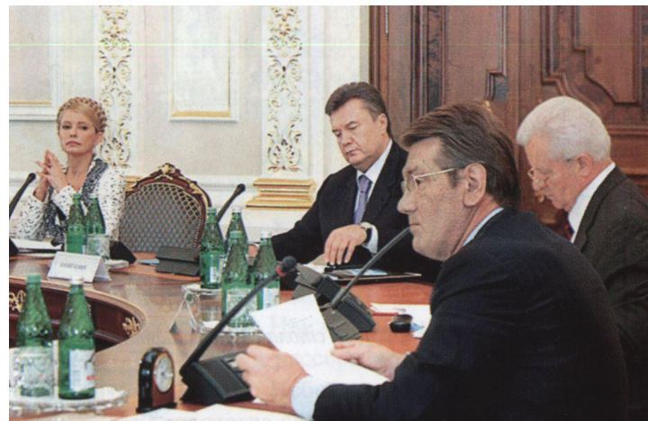
Заседание «круглого стола» в секретариате президента. 27.07.2006