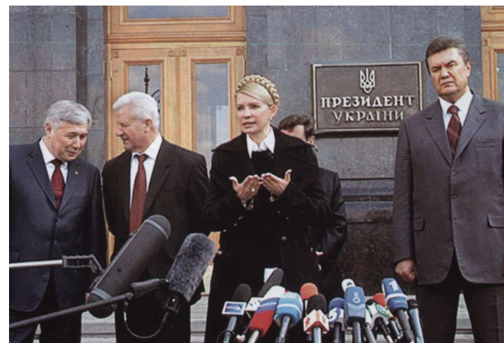
После завершения встречи лидеров политических сил — победителей парламентских выборов — с президентом Украины Виктором Ющенко. 11.04.2006