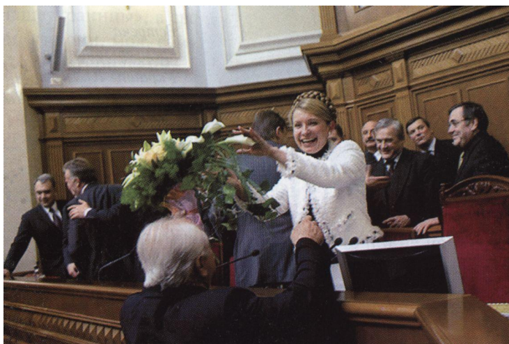
Верховная Рада Украины приняла бюджет на 2005 год. 29.03.2005