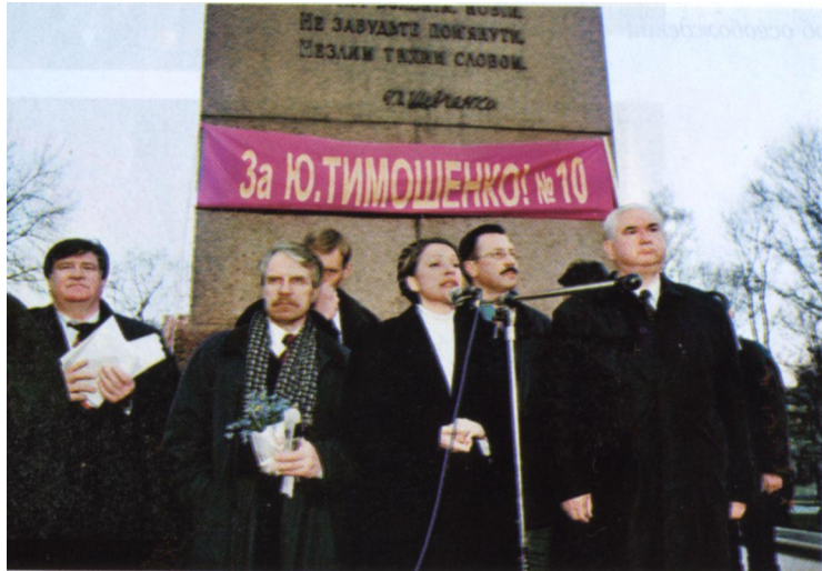
Выступление в Киеве. 15.03.2002