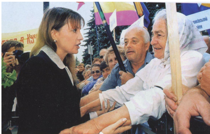
Митинг оппозиции возле Верховной Рады. 9.07.2003