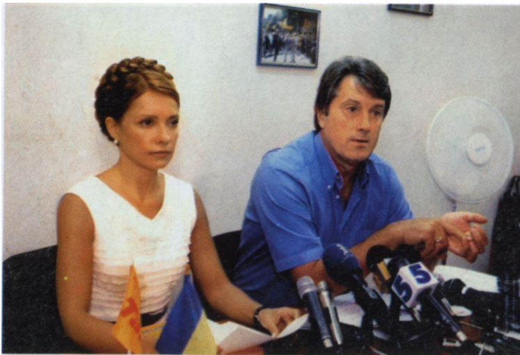
Пресс-конференция кандидата в президенты В. Ющенко и Ю.Тимошенко. 26.08.2004