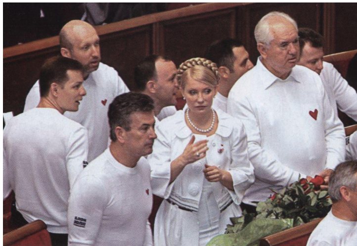
Первый день работы нового парламента. 25.05.2006