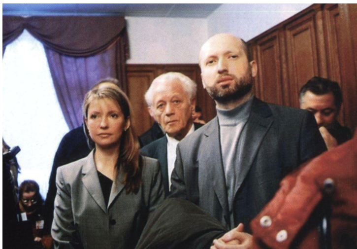
Лидеры акции «Восстань, Украина!» в Верховном суде Украины 22.10.2002