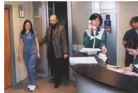
В клинике «Медиком». 2.04.2001