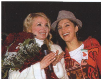
С дочкой Евгенией