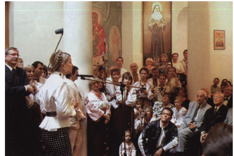
На встрече с представителями Украинской Громады Франции в церкви Святого Владимира Великого в Париже. 17.06.2005