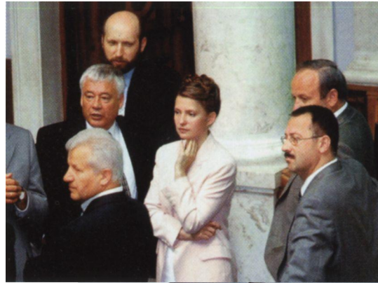
Верховная Рада. 15.05.2002