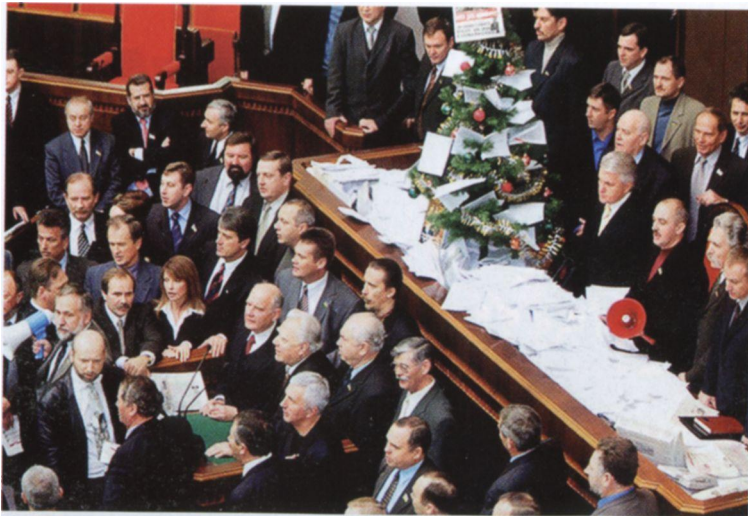
Депутаты оппозиции протестуют против Конституционного переворота в Верховной Раде Украины. 24.12.2003