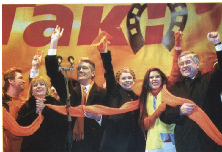
Киев. Майдан. 26.12.2004

заинтересована в участии Юлии Тимошенко в президентских гонках. Считается, что лидер «Батькивщины» может забрать значительную часть голосов Ющенко на Западе Украины и некоторую на Востоке.