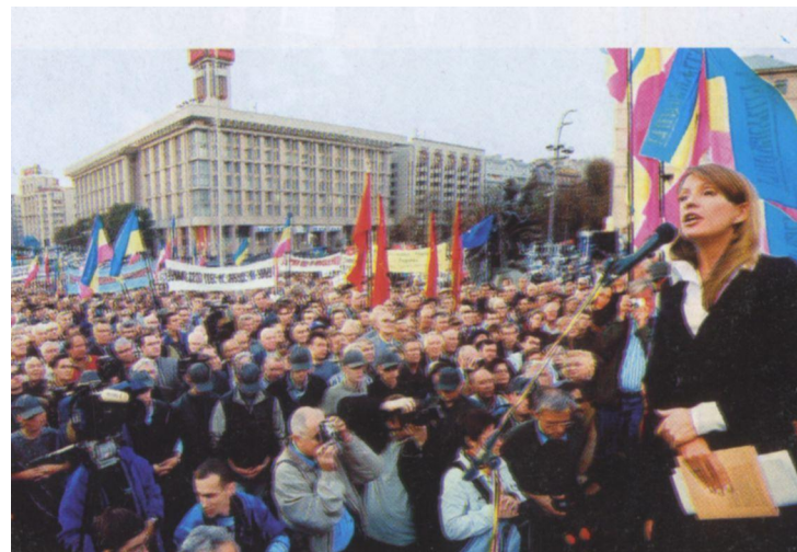
Митинг памяти Георгия Гонгадзе. Киев. 16.09.2003