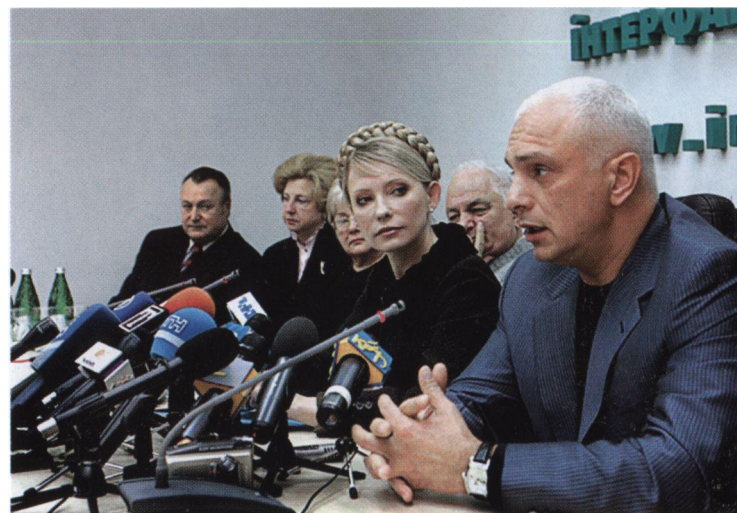
На пресс-конференции Ю.Тимошенко. 21.11.2005