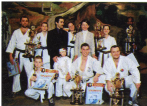
Кубок Ю. Тимошенко — международный турнир по карате. Николаев. 4.03.2002