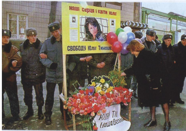
Акція в піддержку Ю. Тимошенко. 13.02.2001