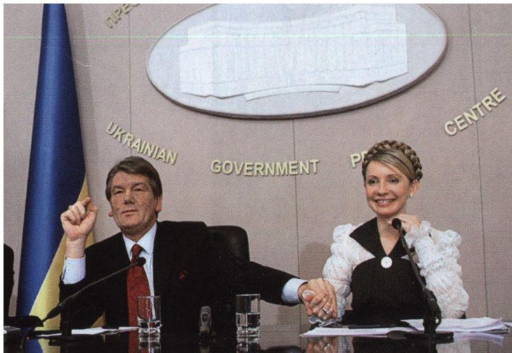
Общая пресс-конференция Ю. Тимошенко и В. Ющенко после утверждения программы «17 шагов правительства». 29.04.2005