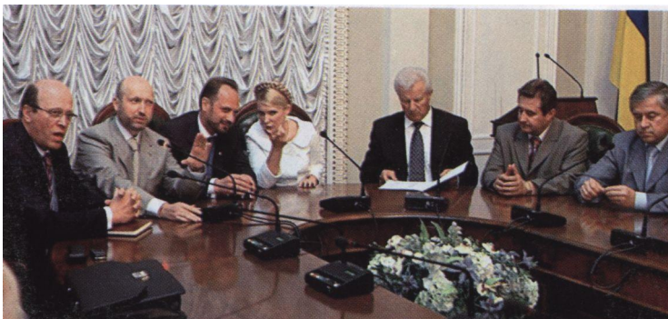
Во время собрания парламентского большинства. 27.06.2006