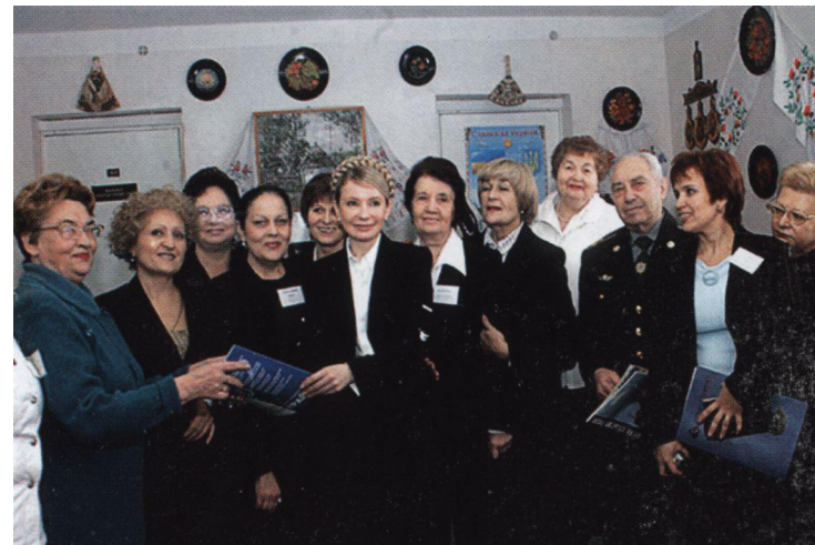
С учителями родной школы. 24.11.2005