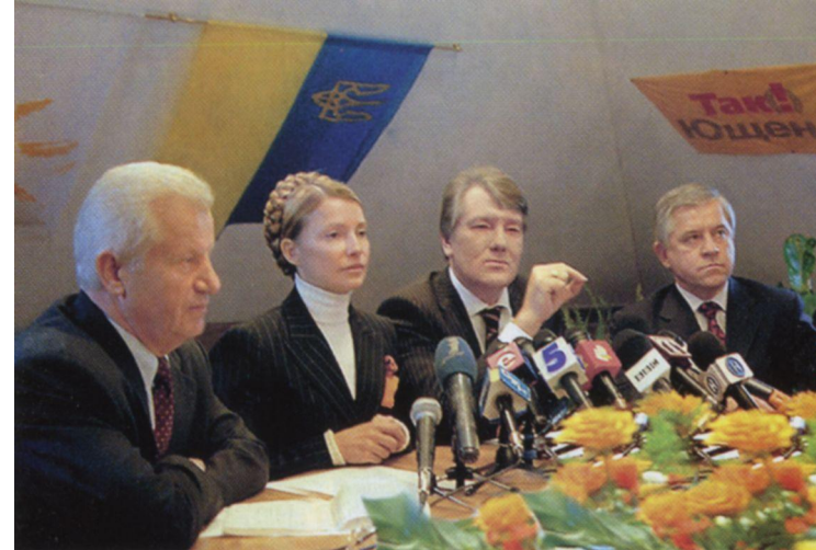
Общая пресс-конференция Юлии Тимошенко, Виктора Ющенко Александра Мороза и Анатолия Кинаха. 21.11.2004