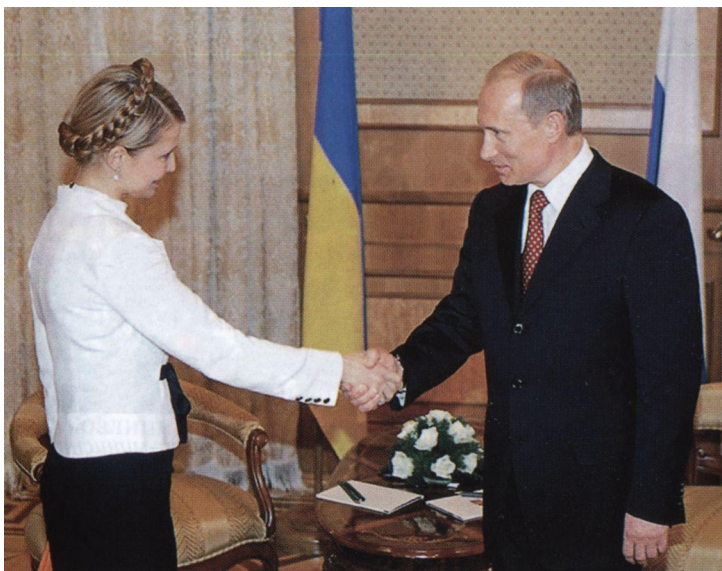
Встреча премьер-министра Украины Ю. Тимошенко с президентом России В. Путиным. 21.03.2005