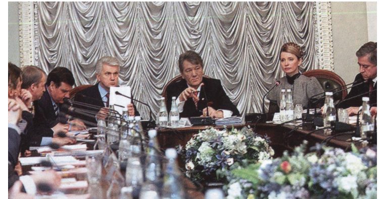
Премьер-министр Украины Ю. Тимошенко проводит первое заседание Кабинета министров Украины. 7.02.2005