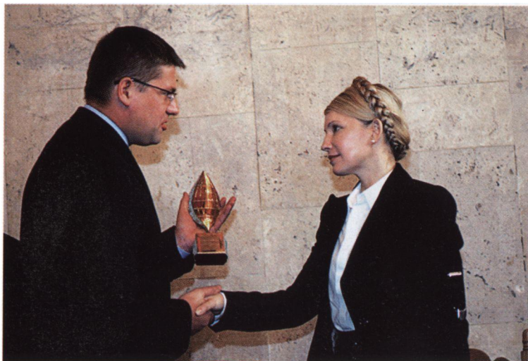
Ю. Тимошенко во время вручения ей награды «Человек года Центральной и Восточной Европы» в посольстве Польши. 7.11.2005