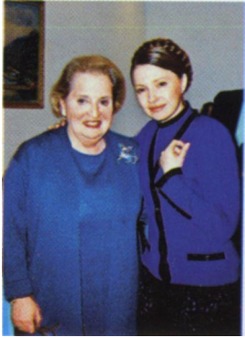
С Мадлен Олбрайт. 16.02.2002