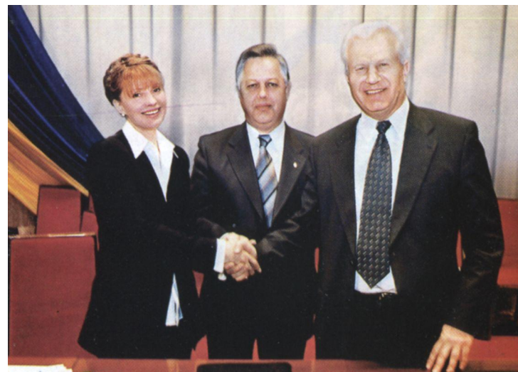
На Всеукраинском чрезвычайном съезде депутатов от оппозиционных сил. 2.03.2003