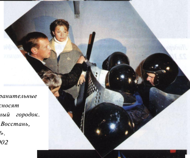
Правоохранительные органы сносят палаточный городок. Акция «Восстань, Украина!». 17.09.2002