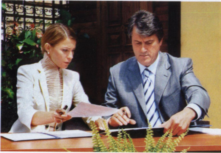
Подписание коалиционного соглашения между Блоком Юлии Тимошенко и блоком «Наша Украина» 2.07.2004