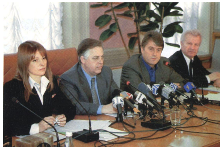
Пресс-конференция лидеров оппозиционной четверки после подписания меморандума единства. 14.04.2003