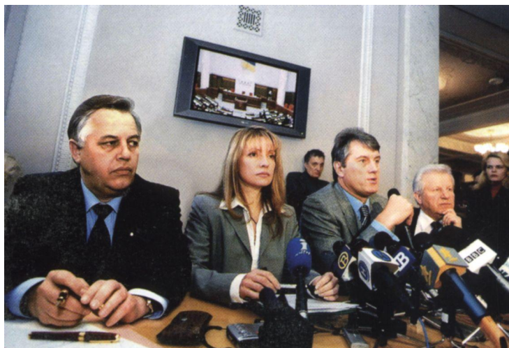
Общая пресс-конференция лидеров четырех оппозиционных сил 19.12.2002