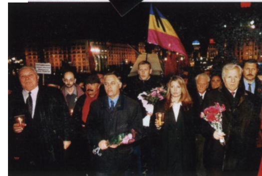
Митинг в память жертв режима Кучмы. Киев. 19.10.2002