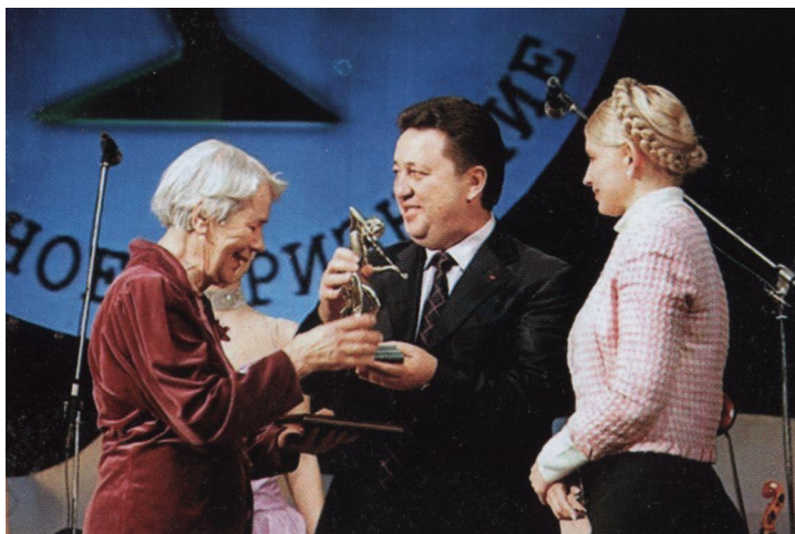
Вручение премий лауреатам ежегодного конкурса «Народное признание». 16.03.2006