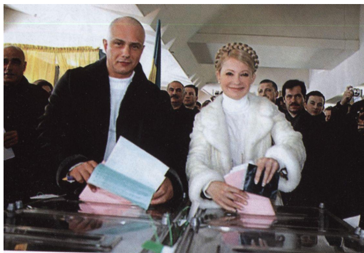
Ю. Тимошенко с мужем на выборах в Днепропетровске, 26.03.2006