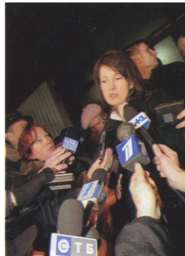
Ю. Тимошенко после визита в Генпрокуратуру Украины. 4.09.2003