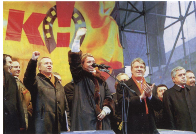
Митинг в поддержку Виктора Ющенко. Киев. Майдан. 22.11.2004