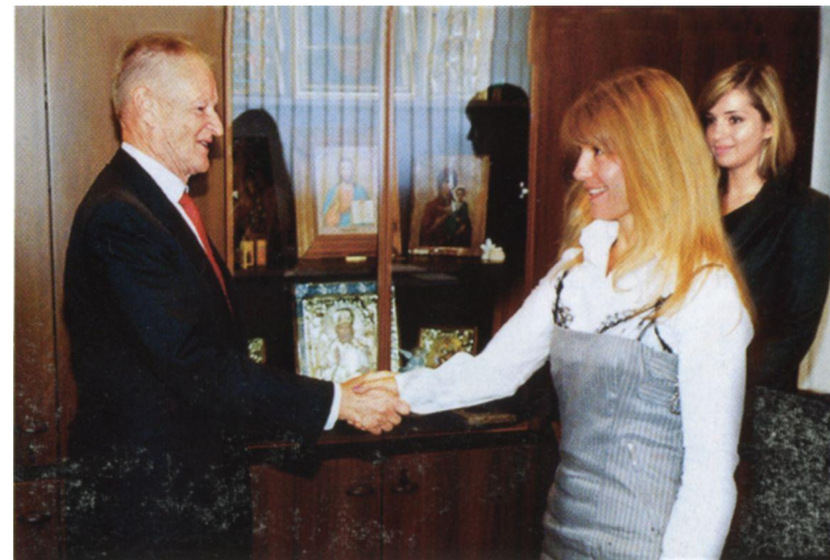
Встреча Юлии Тимошенко и Збигнева Бжезинского. Офис партии «Батькивщина». Май 2004 г.