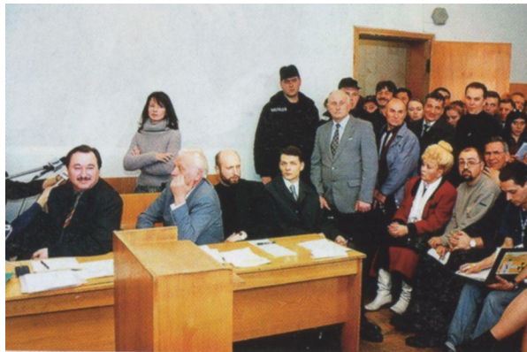
Заседание Печерского народного суда Киева. 1.03.2001