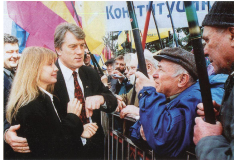
Юлия Тимошенко и Виктор Ющенко на встрече с участниками митинга-протеста против принятия Конституционной реформы возле Верховной Рады Украины. Апрель 2004 г.