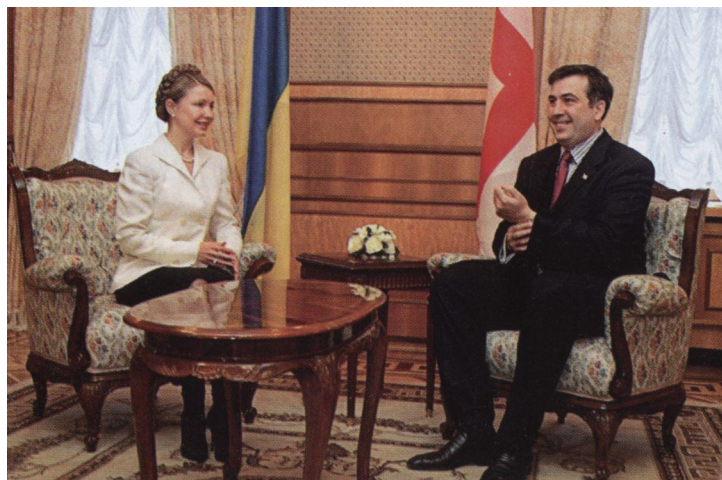
С президентом Грузии Михаилом Саакашвили. 29.03.2005