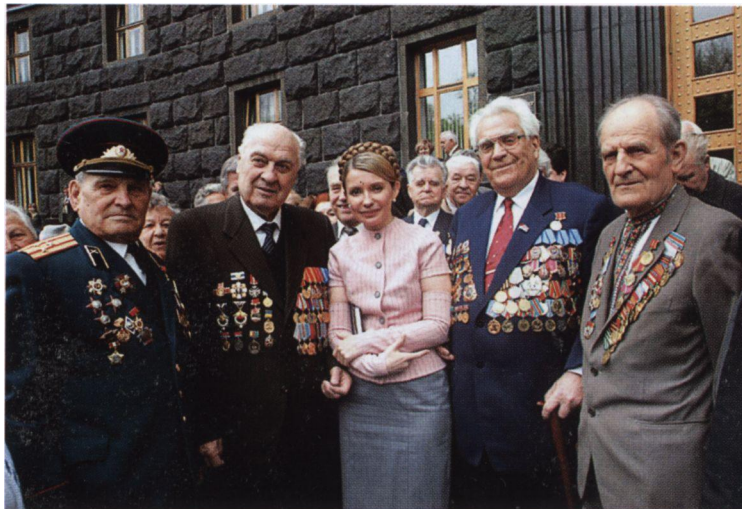
На встрече с ветеранами войны. 6.05.2005