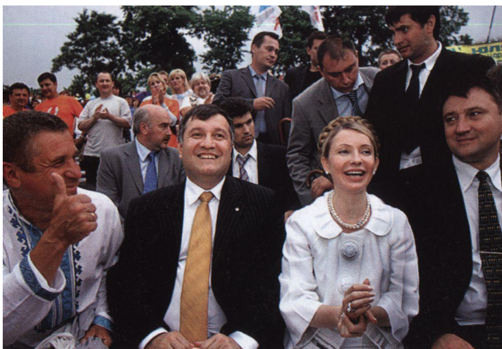
На фестивале искусств «Печенежское поле». 20.07.2005