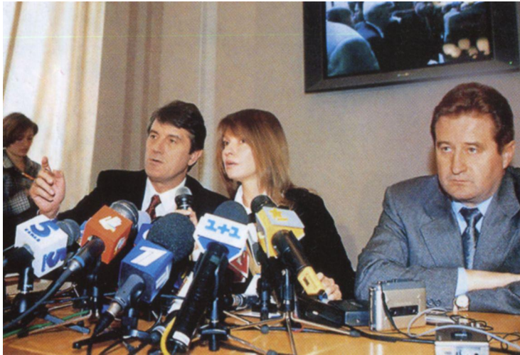
Пресс-конференция лидеров оппозиционной тройки в связи с принятием закона о поправках в Конституцию Украины. Декабрь 2003 г.