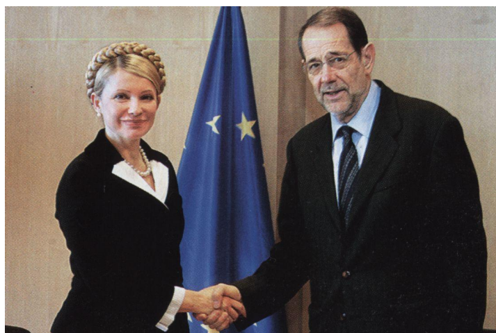
Ю.Тимошенко и Хавьер Солана. Брюссель. 1.02.2006