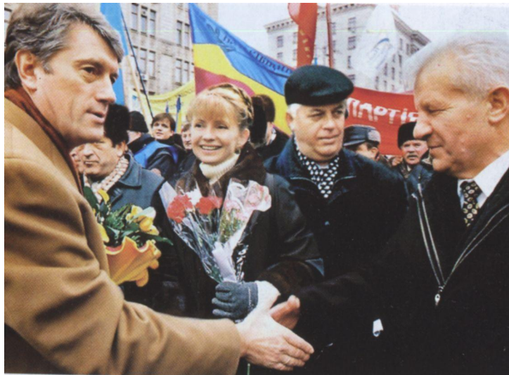
Митинг объединенной оппозиции. Киев. 9.03.2003