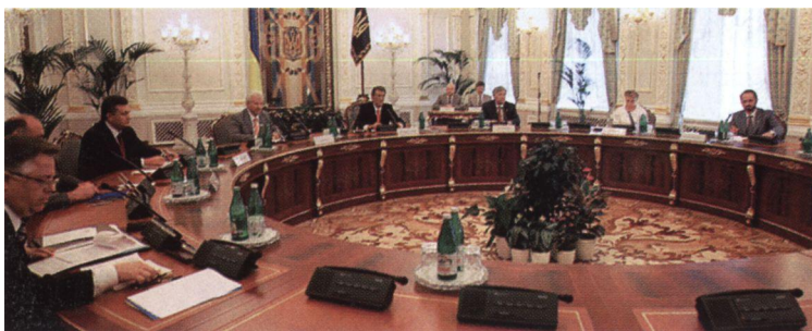
Завершающее заседание «круглого стола» у президента Украины 3.08.2006