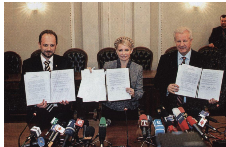
Подписание Протокола о процедуре формирования Коалиции демократических сил в новом парламенте. 13.04.2006