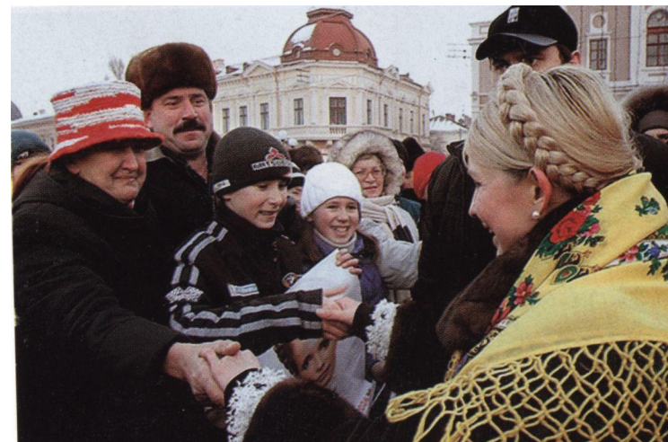
В Черновцах. 16.01.2006