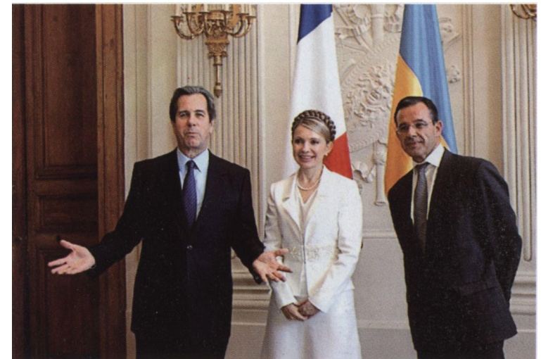
Визит премьер-министра Украины Ю. Тимошенко во Францию. 25.06.2005