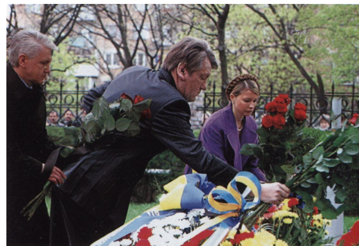
Возложение цветов к мемориалу памяти чернобыльцев. 29.04.2005