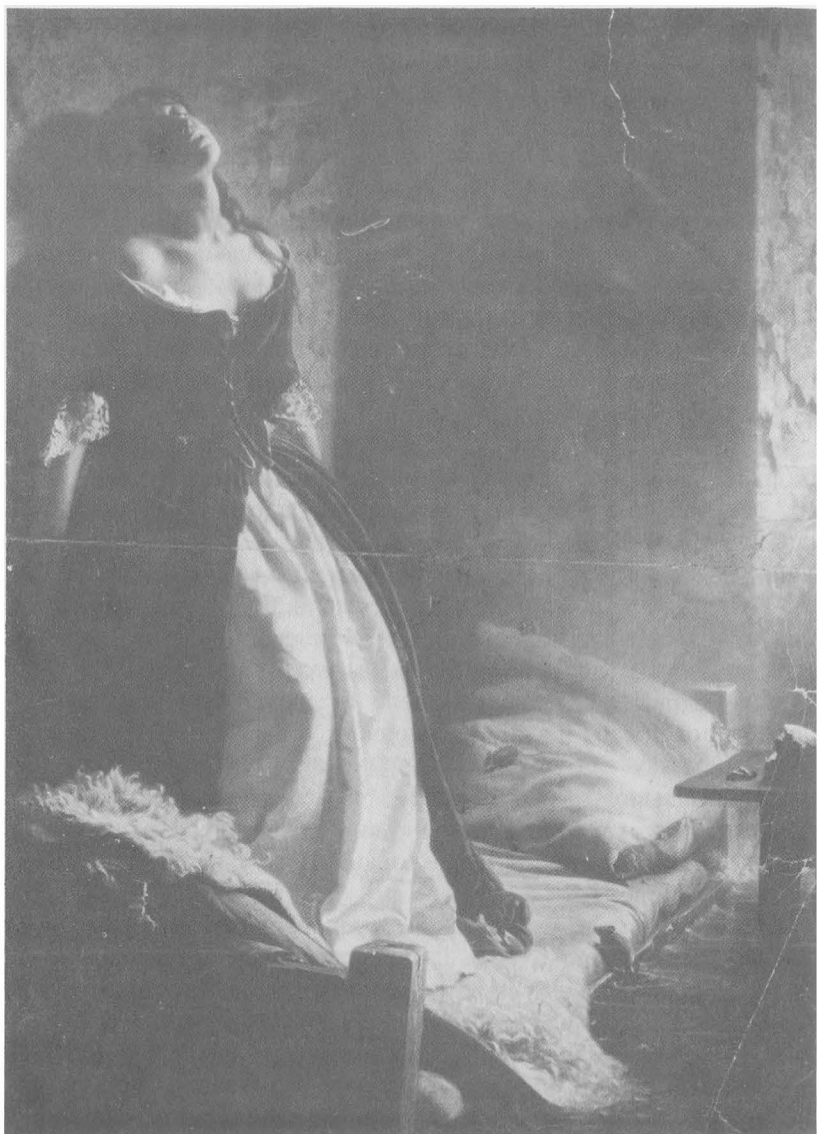
КОНСТАНТИН ФЛАВИЦЬКИЙ: «Княжна Дарган у Петропавлівській фортеці».