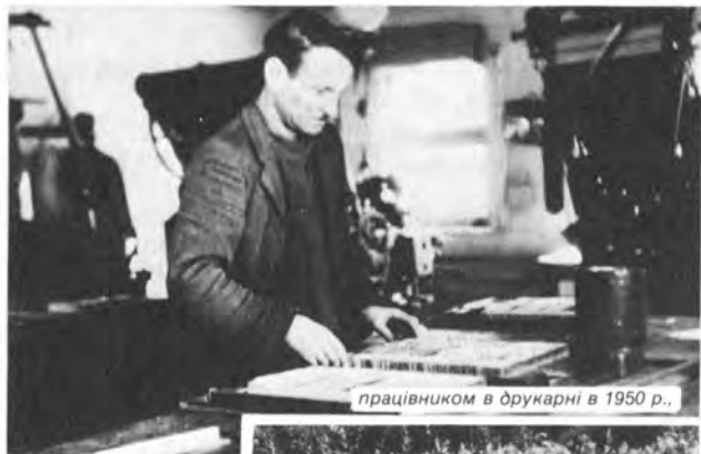
працівником в друкарні в 1950 р.,