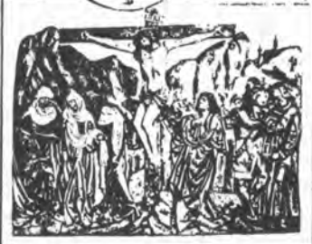
UKRETOVANE TA CAOPPEHO.