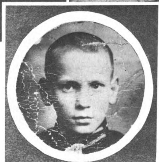
Богдан Кравців у гімназійні роки.