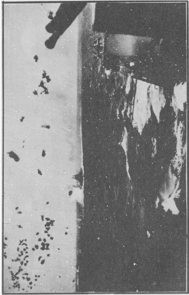
Смерть каміказа, збитого зенітками, біля заатакованого корабля.