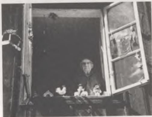
О. Ян Твардовський у вікні своєї кімнати. Варшава, 10.06.2003 р.