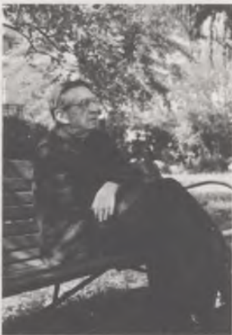
О. Ян Твардовський на лавці під улюбленою модриною в саду біля дому. Варшава, 29.06.1996 р.