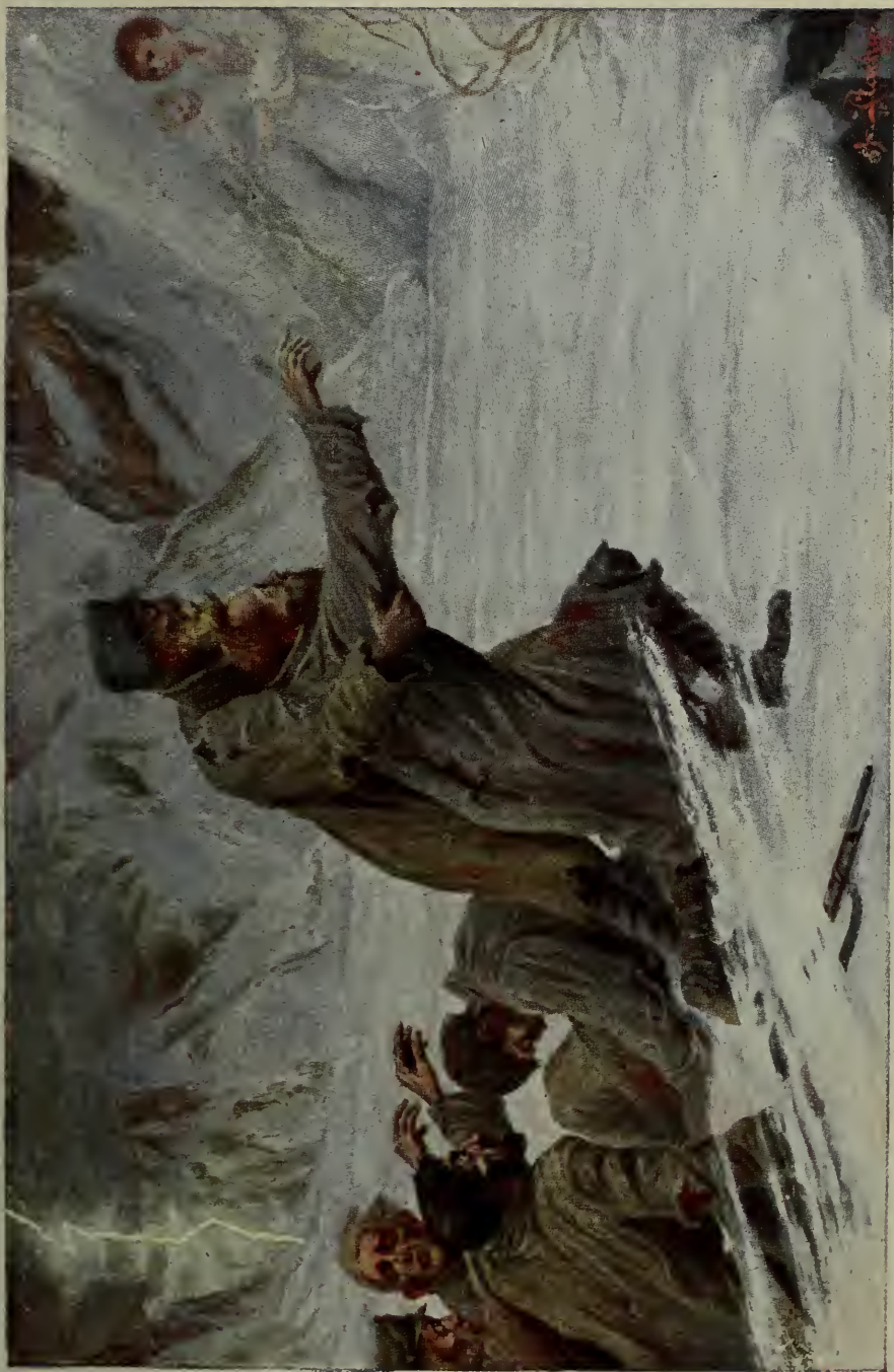
Так, так, це жінка з дитиною, Вона спасе вою час від смерті!