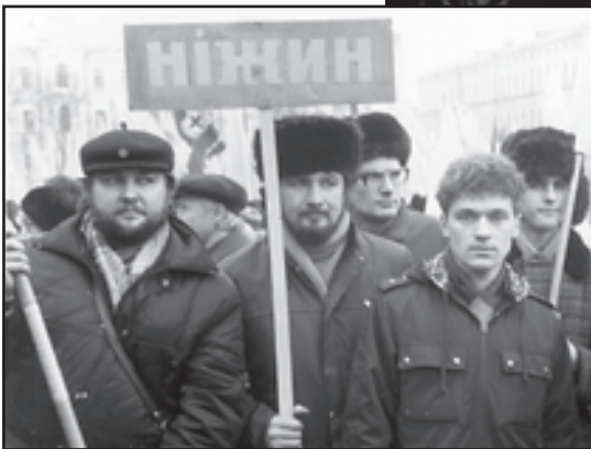
Ніжинська делегація бере участь у живому ланцюзі під час відзначення Злуки УНР і ЗУНР. Київ. Фото. 22 січня 1991 р.