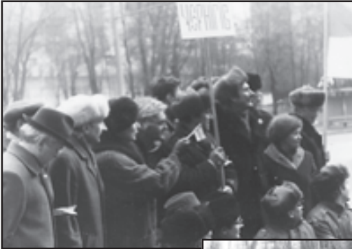
Чернігівська делегація бере участь у живому ланцюзі під час відзначення Злуки УНР і ЗУНР. Київ. Фото. 22 січня 1991 р. (Особистий архів М. Д. Данилюка).

Богослужіння під час відкриття пам'ятного знаку – хреста – Героям Крут за участю делегацій національно-демократичних організацій Чернігівщини, Сумщини, Київщини. Під Крутами. Фото. Січень 1991 р.