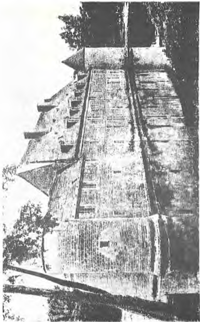
ОБОРОННІ БАШТИ ЗАМКУ Г. ОРЛИКА В ДЕНТЕВІЛЬ (Вид від задньої сторони)