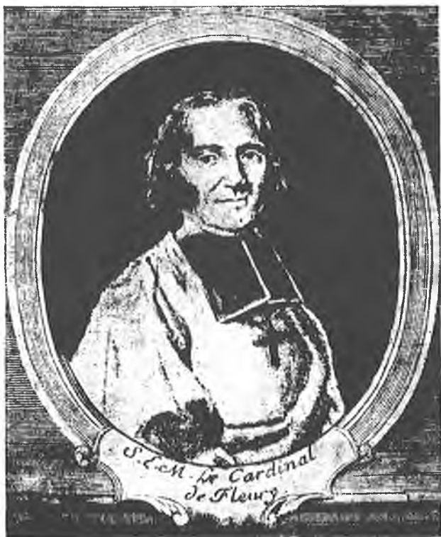
КАРДИНАЛ ФЛЕРІ (З гравюри паризької Нац. Бібліотеки)