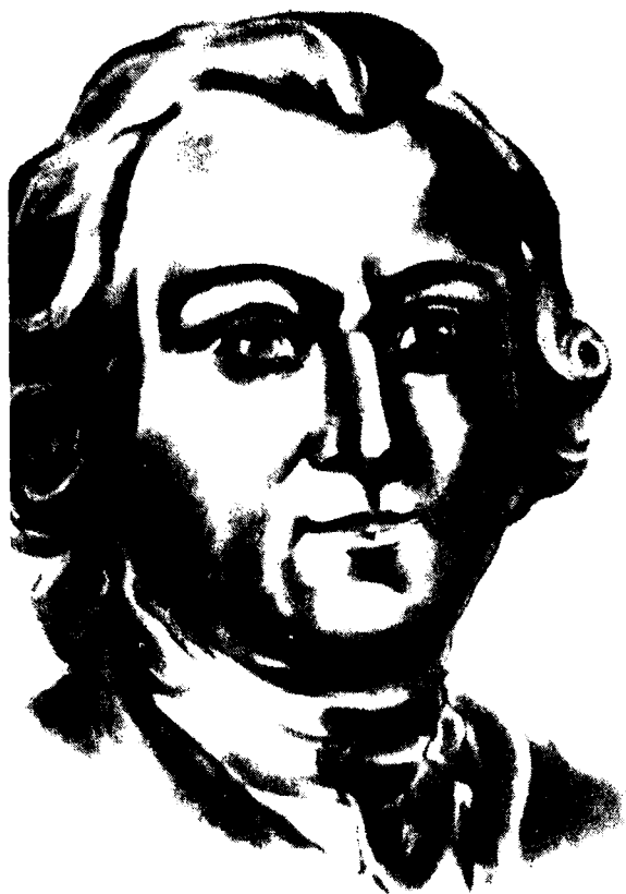
Оксана Лятуринська: Портрет Григора Орлика.