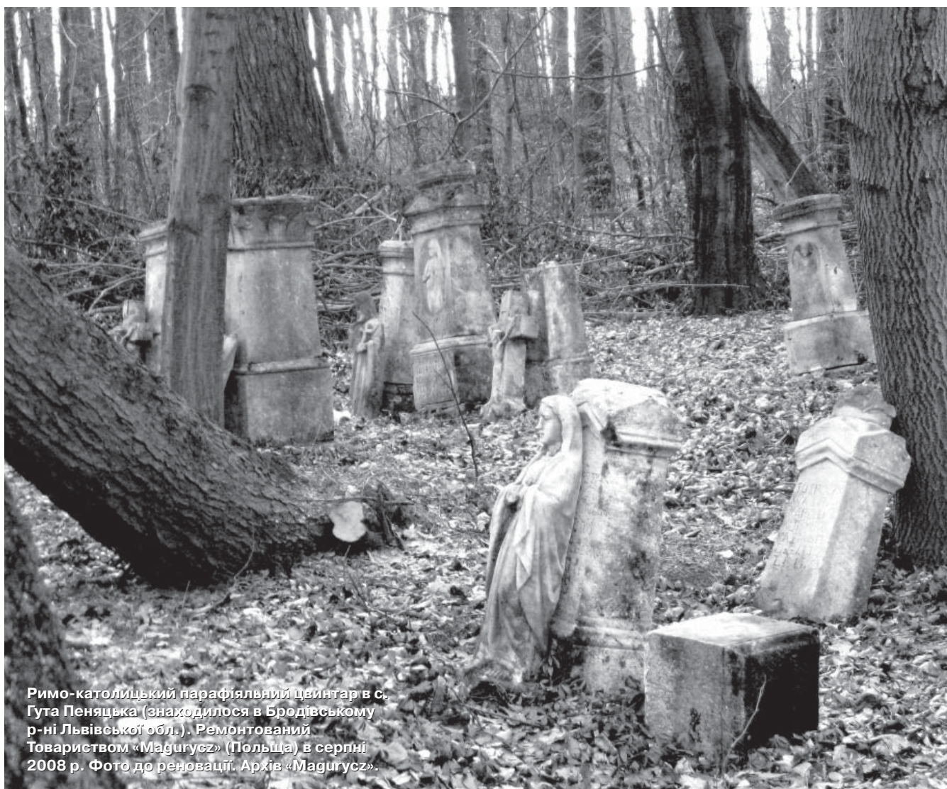
Римо-католицький парафіяльний цвинтар в с. Гута Пеняцька (знаходилося в Бродівському р-ні Львівської обл.). Ремонтований Товариством «Magurcz» (Польща) в серпні 2008 р.

...Отже, за останнє десятиліття багато змінилося у трактуванні антипольських і антиукраїнських акцій 1943–1944 років. Важливо, щоб з 2013 року все знов не пішло по колу. Після всього напрацьованого не заганняймо себе знов у рамки безглузлого ригоризму. Не робімо собі «своїх» однозначних ідолів, адже ідолам належить лише поклонятись, а це дуже небезпечно.