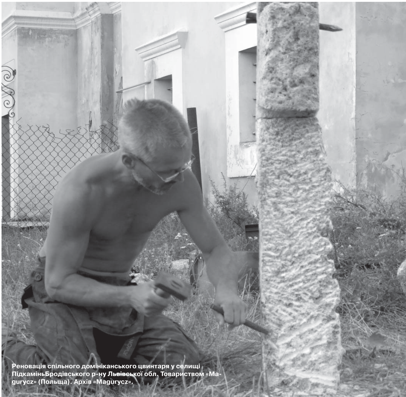
Реновація спільного домініканського цвинтаря у селищі Підкамін'Бродівського р-ну Львівської обл. Товариством «Magurycz» (Польща).

ритетні для них люди, котрі в людській opinii є відвертими агентами Кремля – на кшталт Вадима Колесніченка чи Сергія Ківалова. Від цих людей чекати якоїсь ініціативи чи приймати їхні ініціативи принизливо. Це кремлівські функціонери, котрі не відчують жодної моральної причетності до того, що говорять. Натомість якщо ми цього не скажемо прямо, вони зроблять свою роботу.