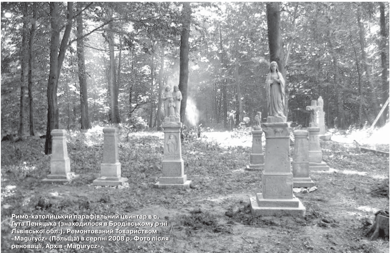
Римо-католицький парафіяльний цвинтар в с. Гута Пеняцька (знаходилося в Бродівському р-ні Львівської обл.). Ремонтований Товариством «Magurycz» (Польща) в серпні 2008 р. Фото після реновації.

Українці – комуністи і регіонали – нині демонструють ту саму «логіку Калі». Вони, звісно, вільні робити, що хочуть. Хай же будуть готові до того, що внаслідок політичного розгулу, що його спровокувала їхня влада, вони теж можуть стати жертвою «праведного» революційного насильства. Ніякі «дзвінки у поліцію» тоді не допоможуть: Як Калі, так і Калі. І нехай же не кажуть тоді, що їх не попереджали.