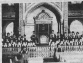
Хор Бродської синагоги (1913 р.)

держан приблизително в готично-флорентійському стилі. По углам здания возвышаются над главным карнизом четыре каменных барабана с куполами. Внутри синагоги имеет весьма благолепный вид» 21 .