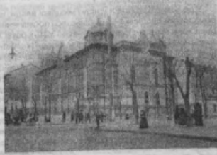
Зовнішній вигляд Бродської синагоги, початок ХХ ст.

У кінці ХІХ ст. Бродська синагога з молитовного будинку перетворюється на справжній культурний центр одеської єврейської інтелігенції. «Над широким амвоном, на урівне галерей для жінок, з восточної сторони здания, були устроєні просторніє хори, на которых впоследствии был смонтирован мощный орган (первый в России)... заслоненный от публики скрижалями Десяти заповедей над «арон-койдеш» 22 .