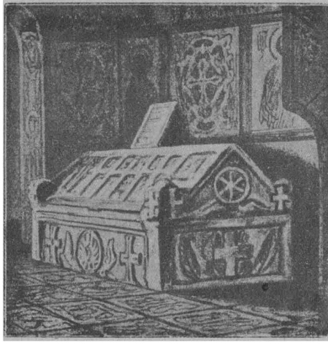
МАРМУРОВА ДОМОВИНА КНЯЗЯ ЯРОСЛАВА.