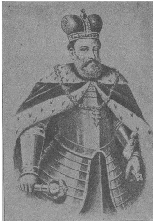
КНЯЗЬ ЛЕВ I.