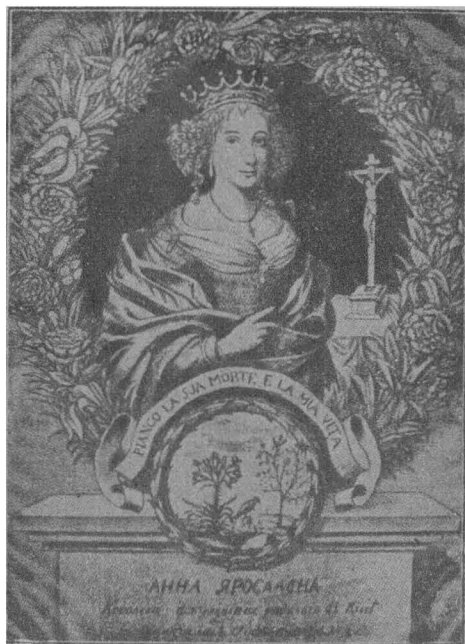
АННА ЯРОСЛАВНА, КОРОЛЕВА ФРАНЦУЗЬКА.

українці воювали при Святославі, і взагалі мали з ними торговельні і культурні зносини. За Прутом, на південь від Карпат, жили Волохи, які в політичному життю IX—X вв. не грали ніякої ролі. За карпатськими горами оселились угри або мадяри, що теж прийшли з-за Волги і перейшли через Україну в 896 році; заснована ними держава трохи згодом почала брати живу участь в справах української Галичини або Червоної Русі. На північному заході від українських волинян та білих хорватів жили словянські племена поляків, або ляхів, які майже одночасно з українцями почали будувати свою державу, і також майже в один час з нашими предками прийняли християнську віру, тільки по римо-католицькому обряду від німецьких проповідників.