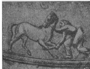
СКИФИ, НАМАЛЬОВАНІ НА НИКОПОЛЬСЬКІЙ ВАЗІ.