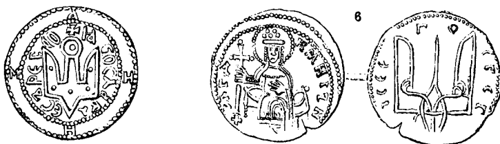
СТАРІ НАШІ МОНЕТИ. (Володимирові й Ярославів.)

називали „отроками“ або „гридями“. Решта населення з часом стала поділятися на городян і селян; городяне — найповажніші і заможніші називалися „старцями градськими“, „лучшими людьми“, решта — бідніші люде, ремісники, прикащики звалися людьми молодшими, черню. Городяне мали більший вплив на політику, збиралися на віче й заявляли на ньому свою волю. Особливо це стосувалося значних столичних міст. Підчас великої війни, коли мало було самої княжої дружини, переважно городяне складали своє „земське“ військо, вибираючи собі „сотських“ і „тисяцьких“. Селян-хліборобів почали називати звичайно „смердами“. Сільські громади, які звалися „вервями“, „погостами“, „волостями“ мали свою самоуправу, спільно користувалися землею і спільно виплачували князеві податки. Помалу збільшилася кляса т. зв. „закупів“, півневільних людей, які позичивши в боярина або якого іншого більшого власника землі чи суму грошей, чи коня, чи які матеріали або хліб, одробляли йому і не могли кинути свого місця, поки не сплачували боргу. Були й зовсім невільні люде: „холопи“ або „раби“, яких або брали на війні в полон, або якими ставали несправні довжники; холопи ці належали звичайно князям та боярам. Іноді заселяли ними цілі села, і вони працювали в полі на своїх панів. Становище рабів було тяжке; воно покращало з прийняттям християнства, коли церков почала ширити погляди про потребу людяного поводження з рабами, як і з іншими людьми.