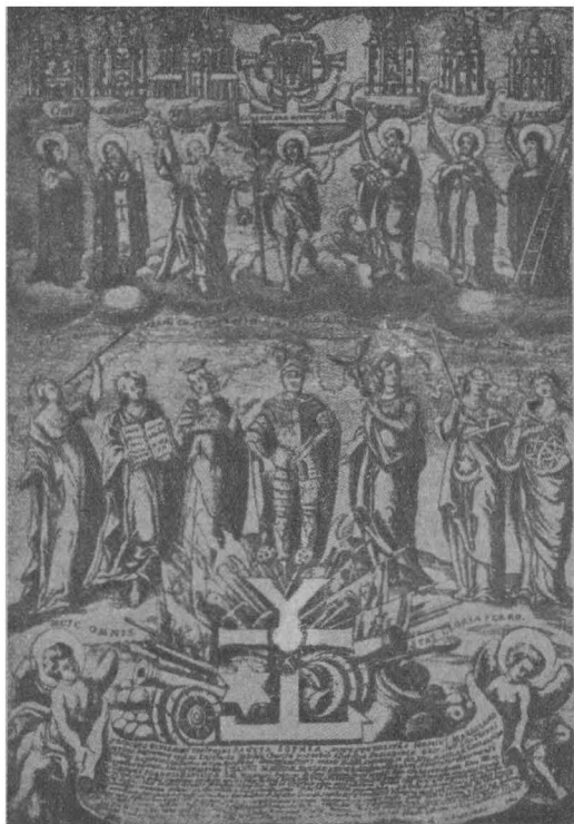
ШТИХ МІГУРИ ПРИСВЯЧЕНИЙ МАЗЕПІ (гетьман посеред алгоричних постатей, які зображують його добрі діла. В горі церкви, збудовані Мазепою.)

монастирів і від владик одібрано їхні маєтності й замість того положено їм невелике удержання від уряду. При цьому багато монастирів, які служили колись культурними осередками українськими й були зв'язані з пам'ятками нашої історії, було зовсім скасовано. На Україні було заведено такі ж церковні порядки як і у Московщині, чужі й незвичні нашому народові. Це повело до упадку великої сили філантропічних закладів, т. зв. „шпиталів“ і добродійних брацтв, які існували при українських монастирях і церквах. Це відбилось і на повному занепаді народньої освіти, також зв'язаною з церквою й її вибираним мирянами духовенством.