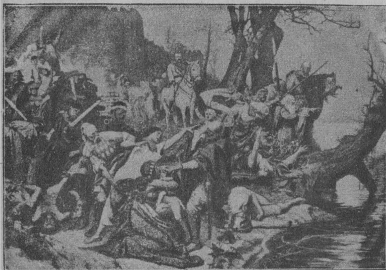
ПОХОРОН РУСИНА. (З образу Семірадського.)

В українців не було ні храмів, ні жерців, як майже і у всіх інших слов'ян (за винятком надбалтійських). Не було в їх і ідолів, і тільки вже за князя Володимира поставлено в Києві ідоли Перуна. Молилися в лісових пущах або біля води. Віра виявлялася не стільки в молитвах, скільки у виконанню правникових звичаїв, тісно зв'язаних з зміною пори року. В грудні святкували народження нового сонця, співали коляд та щедрівок, справляли кутю. Весною, в час теперішніх масниць, вітали прихід весни різними ігрищами й піснями. В літку справляли Купайла з забавами в ночі, — палили вогні й скакали через них, плели вінки, співали особливих пісень. Більша частина цих свят злилася пізніше з християнськими святами, а різні забави, ігрища й пісні збереглися до наших часів, не вважаючи на те, що християнська церква довгі століття боролася з ними і старалась їх винищити, як ознаку поганства. В цих піснях та обрядах дійшли до нас відгуки далекої поганської старовини.