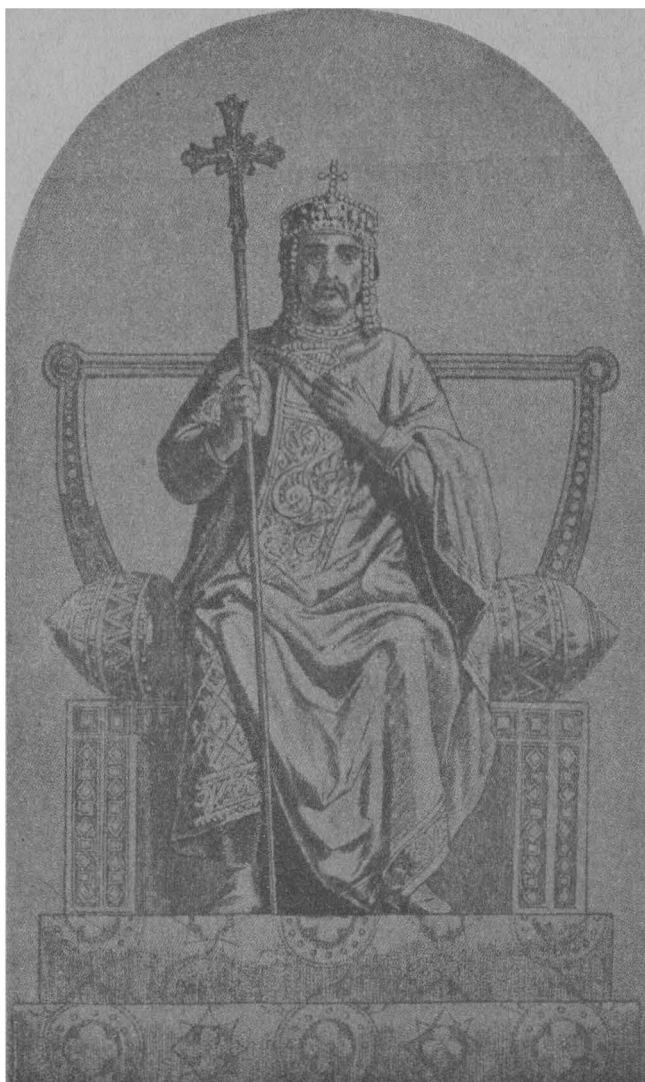
КНЯЗЬ ВОЛОДИМИР ВЕЛИКИЙ НА ПРИСТОЛЕ.